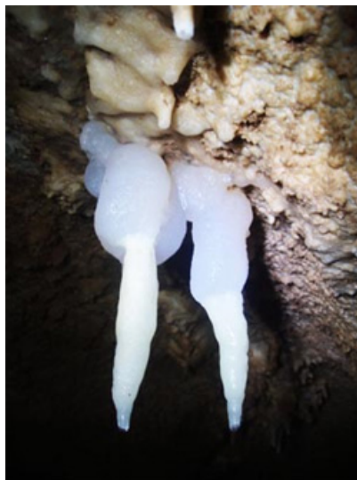
Сталактиты редкой голубой окраски. Своим цветом они обязаны примесям меди