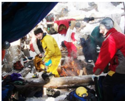
Лагерь возле входа в Ботовскую пещеру. Команда спелеологов готовится к заходу под землю