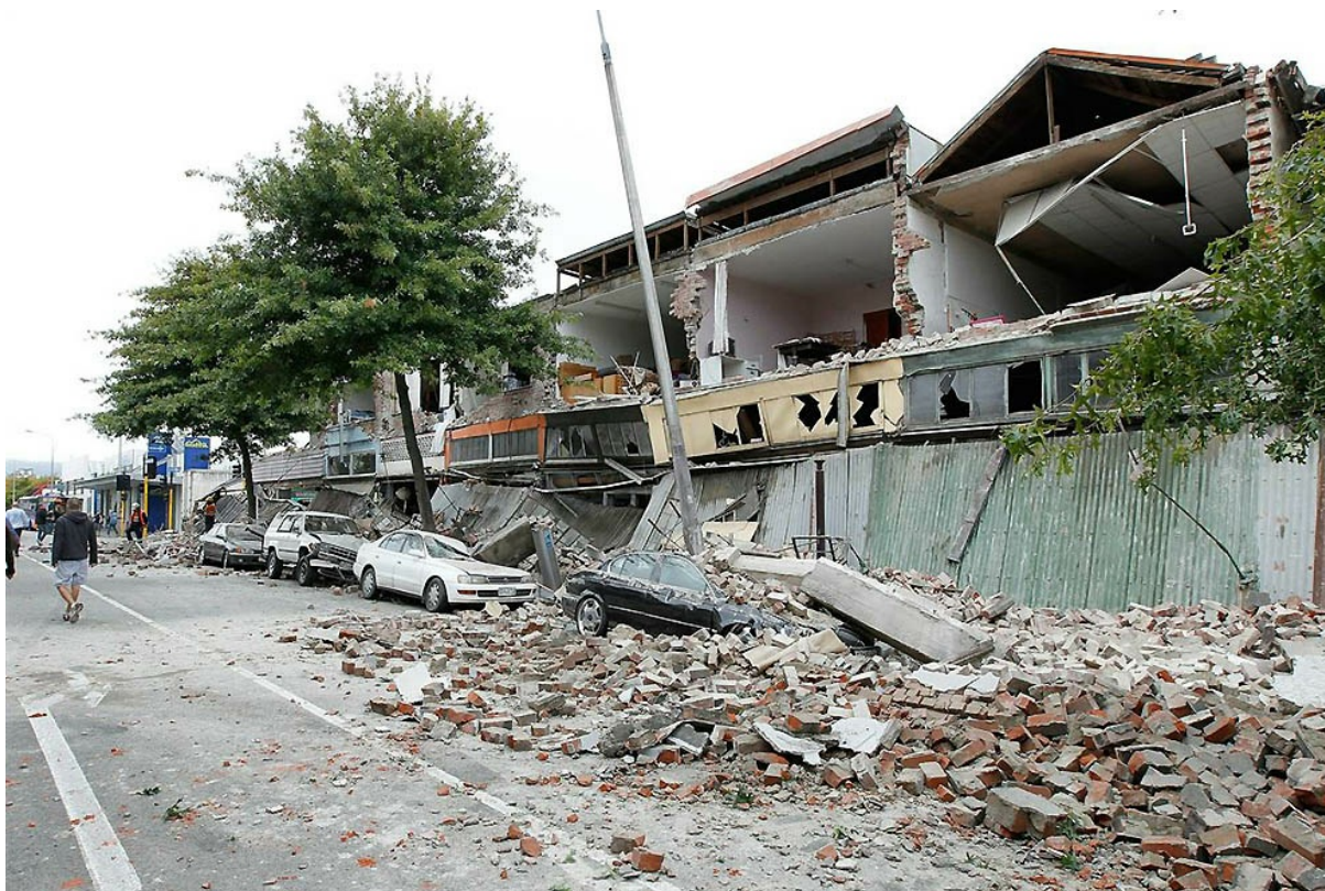
Землетрясение было зафиксировано в 12.51 вторника по местному времени (22.51 понедельника мск).