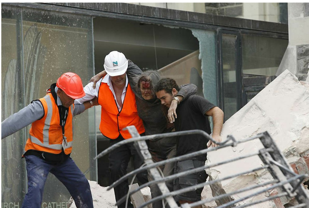
Эпицентр толчков находился на глубине 5 км примерно в 10 км к юго-востоку от города Крайстчерч, расположенному на острове Южный. На фото: спасатели выводят раненую женщину из здания, поврежденного землетрясением.