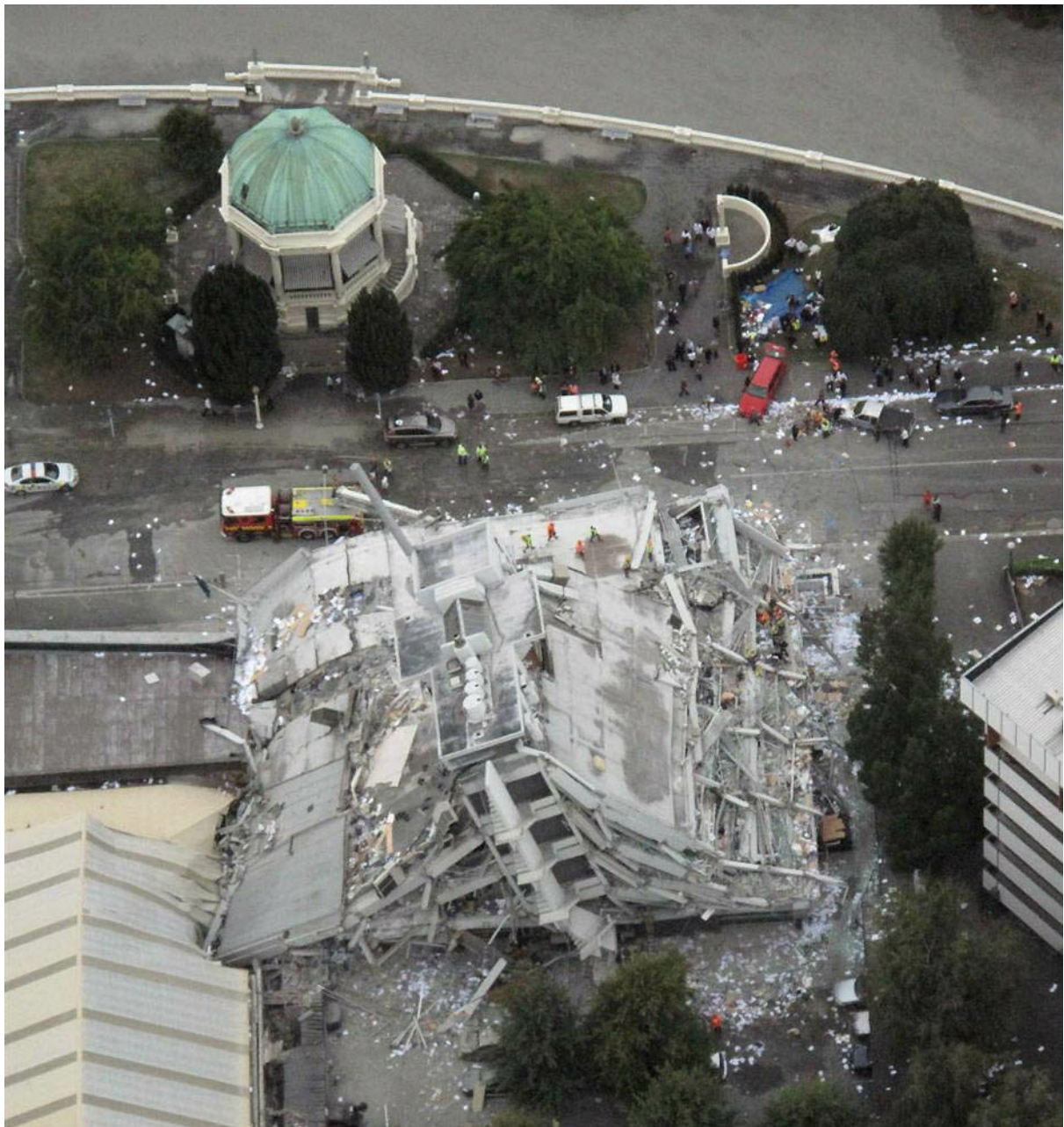
Мэр Крайстчерча Боб Паркер сообщил, что городу нанесен огромный ущерб и что на его восстановление потребуется помощь других областей Новой Зеландии. На фото: Полностью разрушенное 4-этажное здание корпорации "Pune Gould" в Крайстчерч.