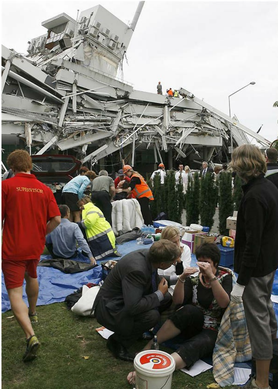
Пострадавшим оказывают медицинскую помощь, в то время, как спасатели заняты поисками попавших под завалы людей.