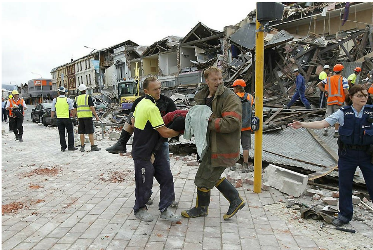
Магнитуда первого толчка составила 6,3. Вслед за ним последовала серия афтершоков, магнитуда сильнейшего из которых, зафиксированного через 14 минут после первого толчка, составила 5,7. На фото: спасатели несут труп женщины, погибшей под завалами.