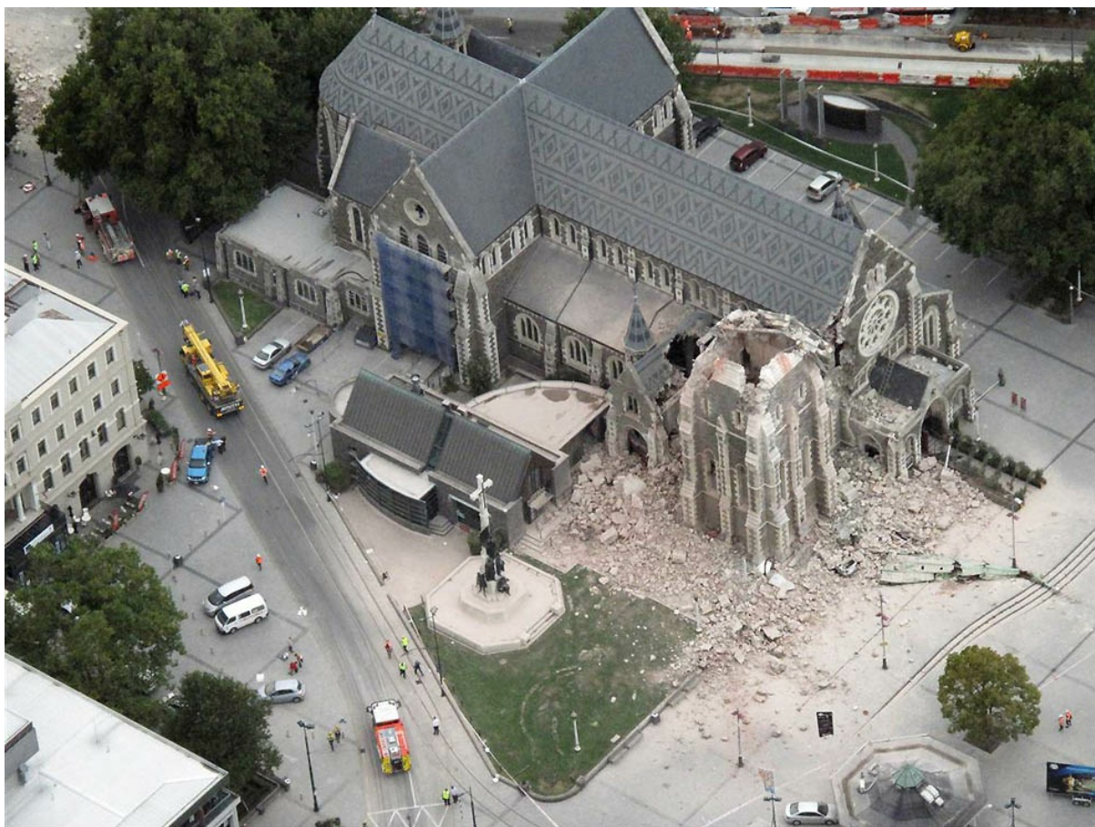
Вид сверху на обломки рухнувшей часовни кафедрального собора в городе Крайстчерч. В соборе, возраст которого составляет 106 лет, только недавно завершился ремонт после предыдущего землетрясения, произошедшего в сентябре 2010 года. Кроме того, предполагается, что под обломками собора могут находиться люди.