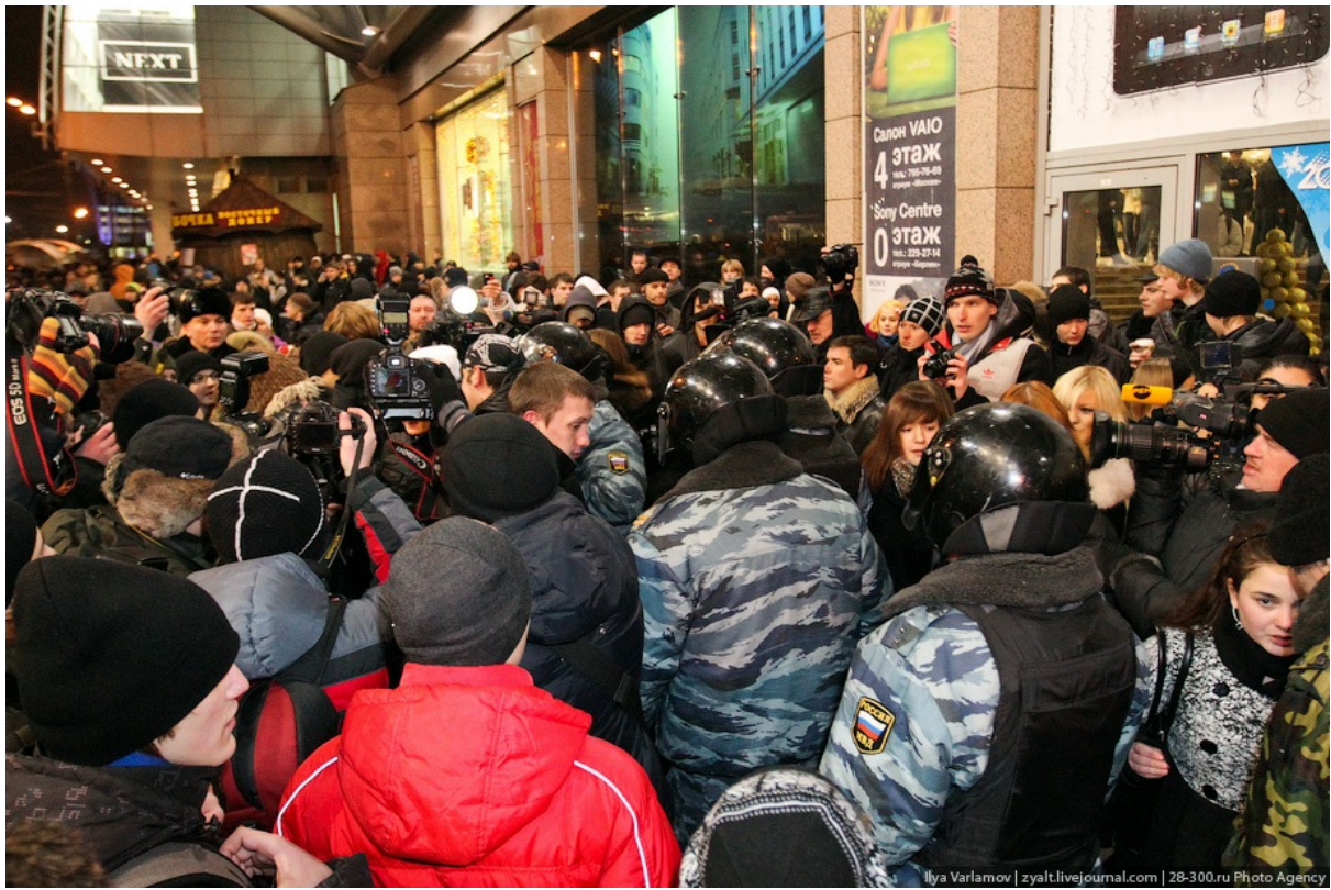
ОМОН начал зачистку.