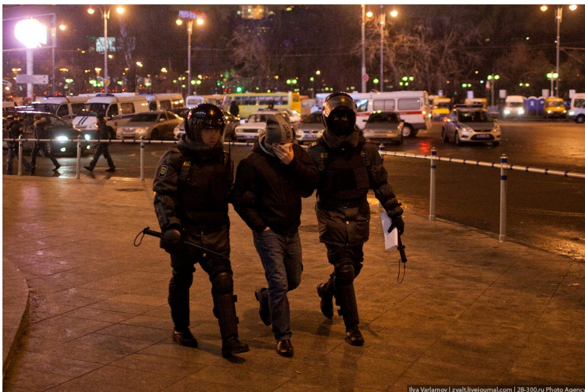
Парень, официант из кофейни, вышел покурить и его сразу скрутили.