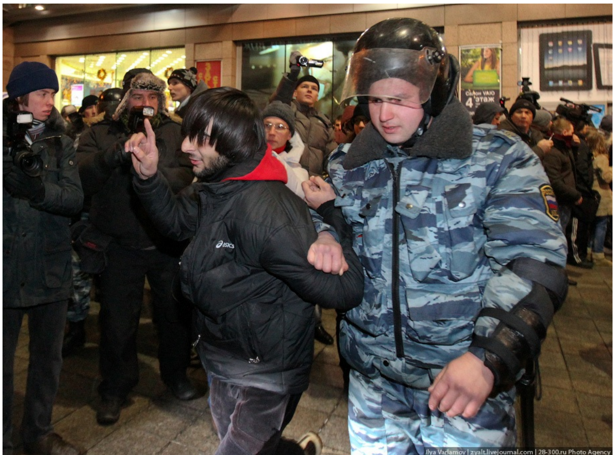
Так как русских было намного больше, в первую очередь выводили всех кавказцев. Перед автобусом задержанных спрашивали: "Русский или кавказец?" От ответа зависело, в какой автобус посадят.