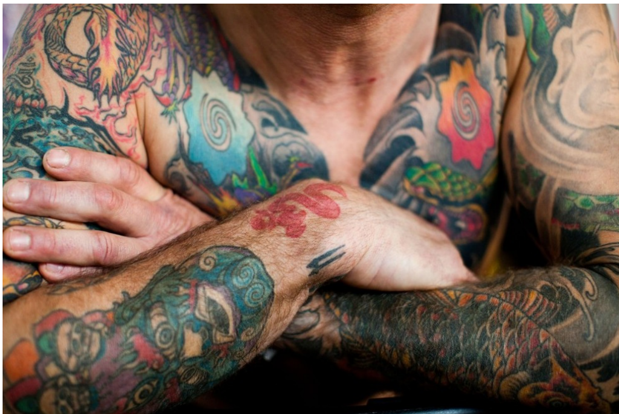
В этом году Берлинский тату-фестиваль проходил с 3 по 5 декабря в в аэропорту Темпельхоф.