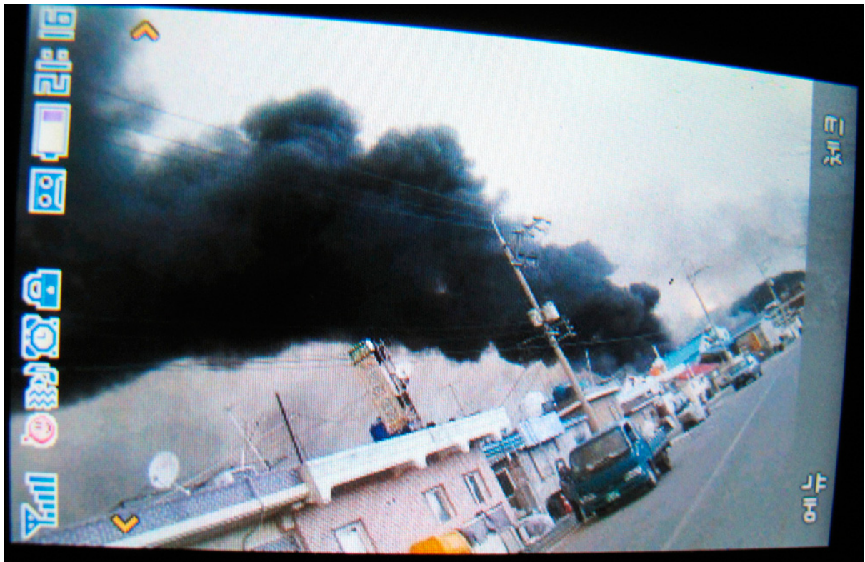
Это фото дыма, поднимающегося от здания на острове Йонпхендо после обстрела Северной Кореей, было сделано на мобильный телефон жителем острова.