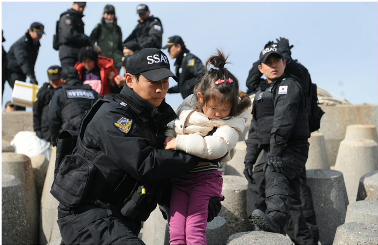
Члены южнокорейской береговой охраны эвакуируют жителей с острова Йонпхендо после его обстрела Северной Кореей.