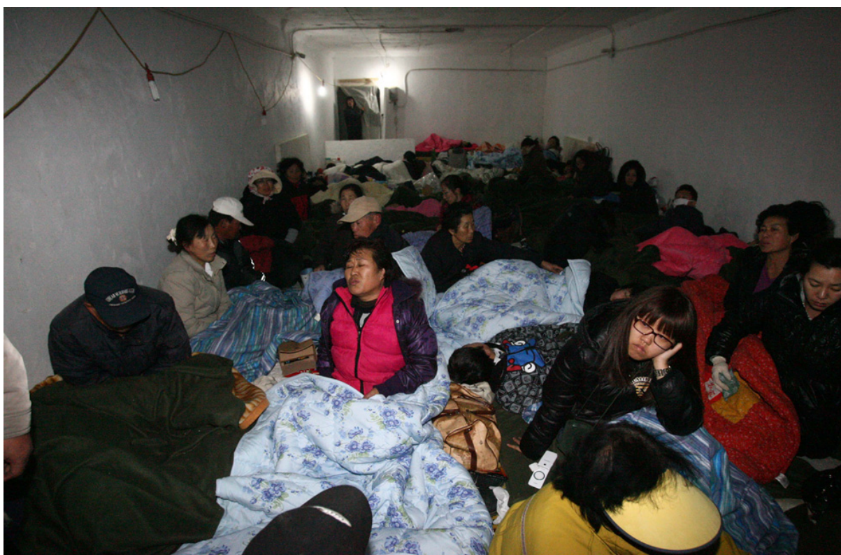
Жителей эвакуировали в бомбоубежище на острове Йонпхендо.