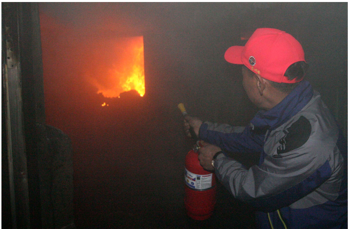
Житель острова Йонпхендо пытается потушить пожар в доме после обстрела острова Северной Кореей 24 ноября.