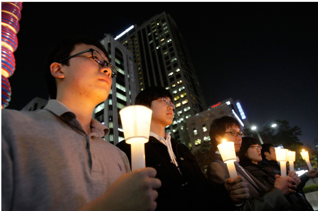
Южнокорейцы чтят минутой молчания память солдат, погибших в недавнем обстреле Северной Кореи, в Сеуле 23 ноября.