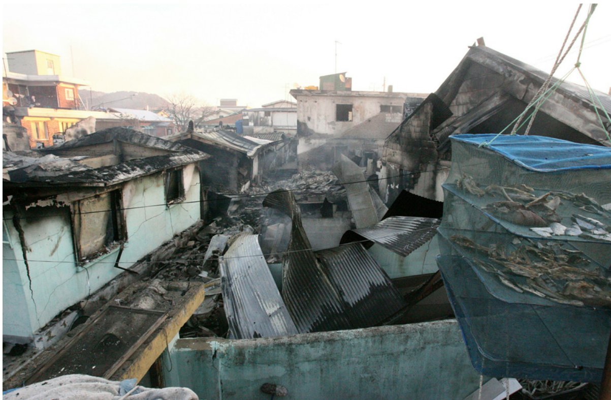
Развалины домов после обстрела острова Северной Кореей.