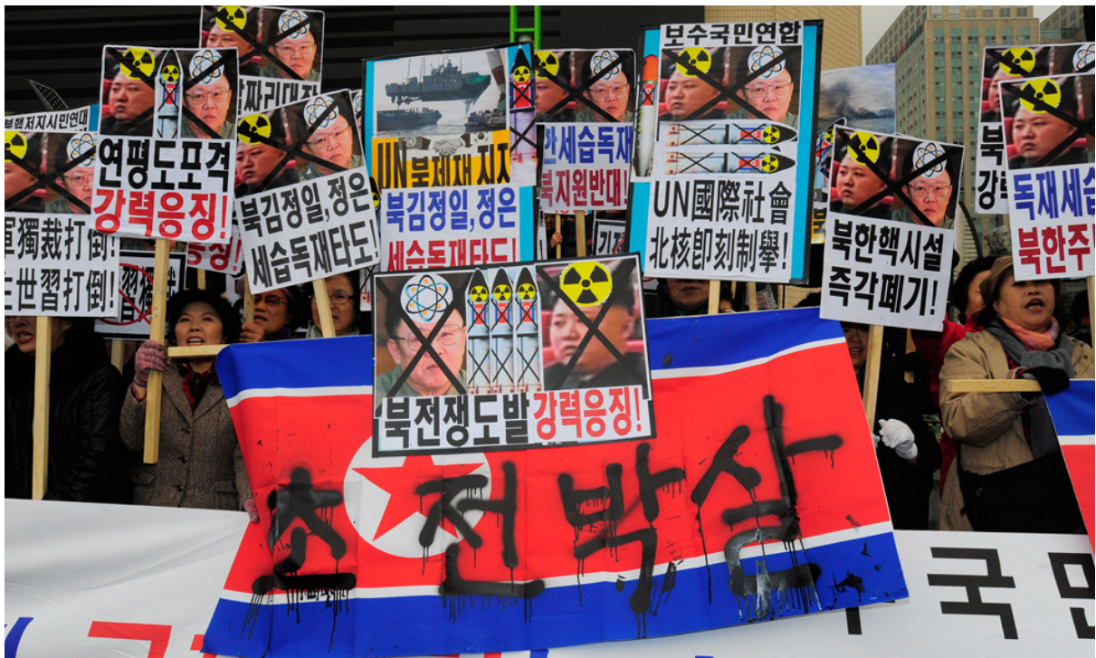
Южнокорейские участники акции протеста с перечеркнутыми фотографиями лидера Северной Кореи Ким Чен Ира и его сына Ким Чжон Ына выкрикивают лозунги во время митинга против атаки Северной Кореи на остров Йонпхендо, в Сеуле 24 ноября. Надпись на флаге: «Разбить».