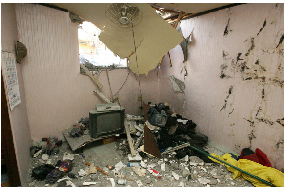
Интерьер дома сильно поврежденного после обстрела.