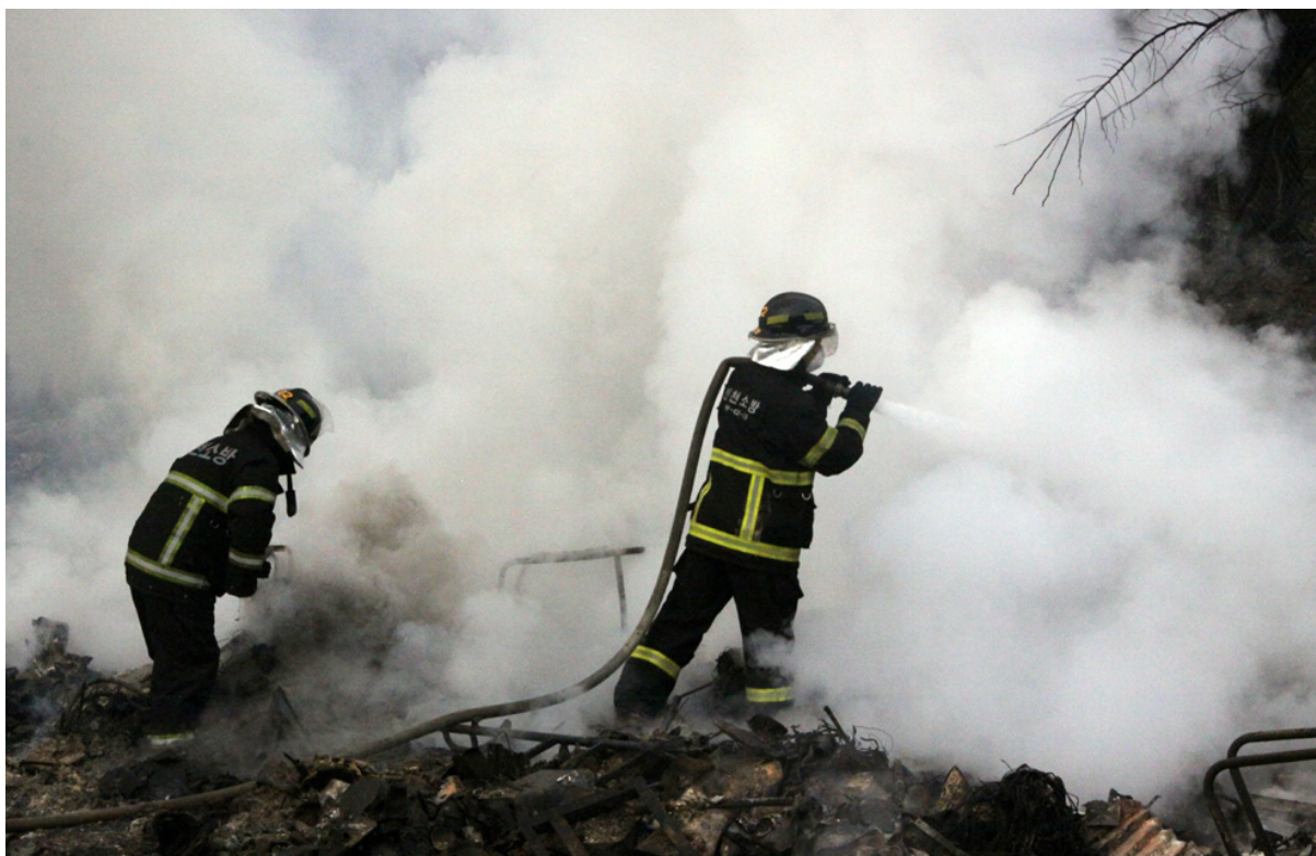
Пожарные тушат огонь на острове Йонпхендо в водах Желтого моря 24 ноября. (Incheon Fire and Safety/AFP/Getty Images)5. Пожарные тушат огонь на острове Йонпхендо в водах Желтого моря 24 ноября. (Incheon Fire and Safety/AFP/Getty Images)