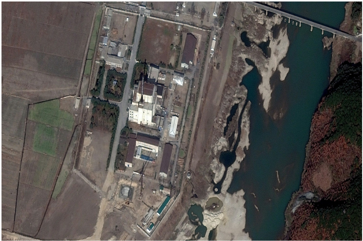
Снимок строительства ядерного комплекса в Северной Корее со спутника. Северная Корея представила новый завод по обогащению урана с 2000 центрифугами, и это вызвало опасения у мирового сообщества. США обвинили Северную Корею в несоблюдении санкций ООН и в том, что она ищет способы вывести из равновесия весь регион.