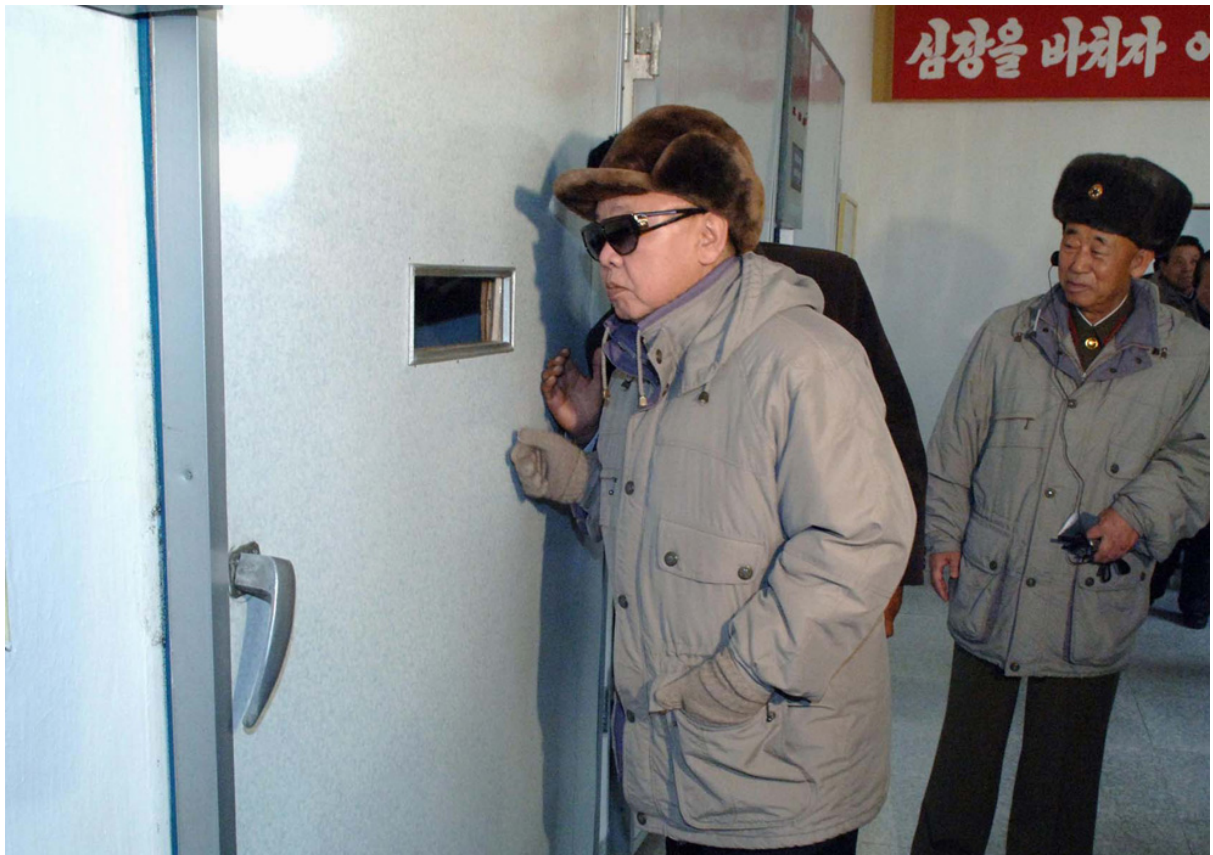
Лидер Северной Кореи Ким Чен Ир (в центре) осматривает утиную ферму во время своей поездки в Ryongyon.