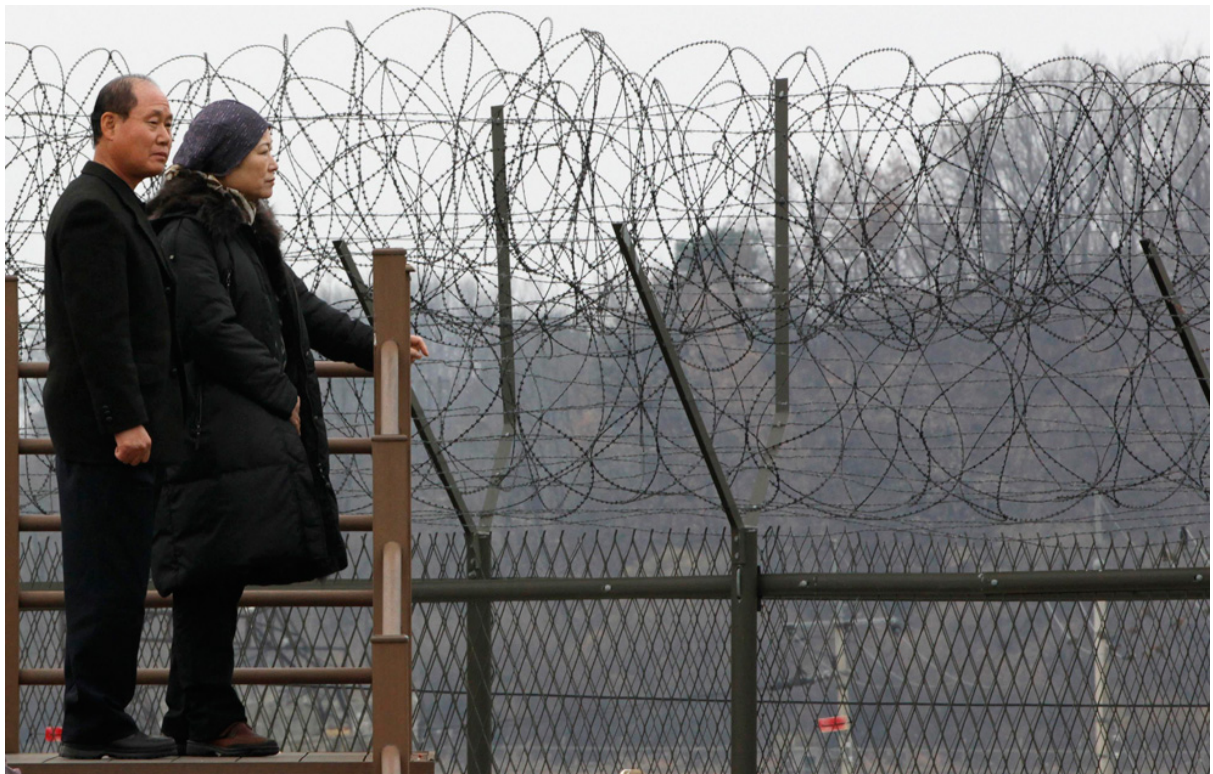
Южнокорейцы смотрят на огороженные территории недалеко от демилитаризованной зоны, отделяющей две Кореи, в Пхаджу, в 55 км к северу от Сеула, 24 ноября. Командование ООН призвало Сеул к переговорам с Северной Кореей, чтобы попытаться ослабить напряжение на полуострове после крупного обстрела острова.