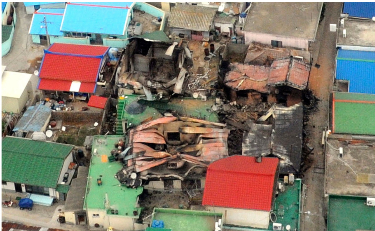
Вид с воздуха на разрушенный после обстрела дома на острове Йонпхендо.