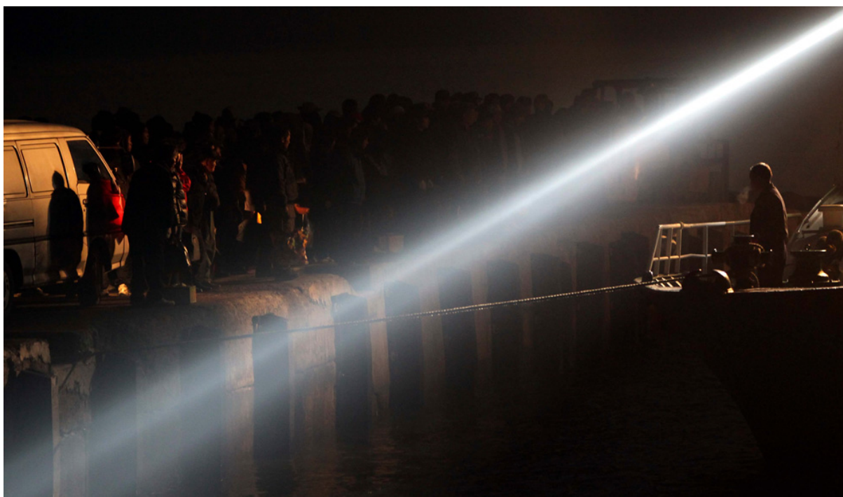
Жители ждут корабль, чтобы покинуть остров.