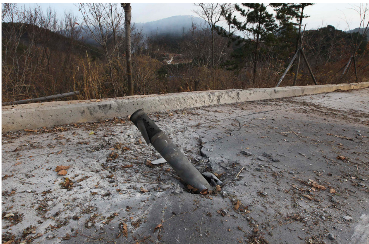
Один из снарядов Северной Кореи.