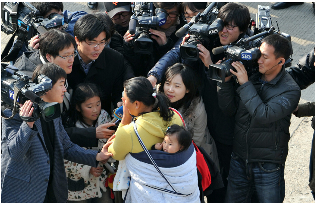
Журналисты берут интервью у местных жителей после обстрела острова.