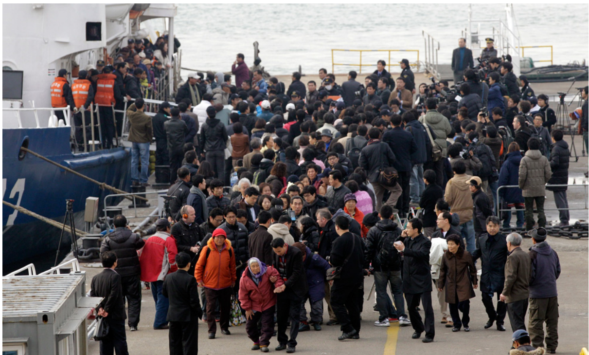
Родственники и журналисты встречают прибывших в аэропорт Инчона.