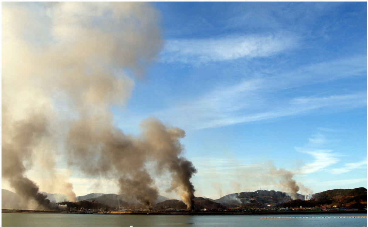
Остров Йонпхендо дымится после обстрела Северной Кореей.