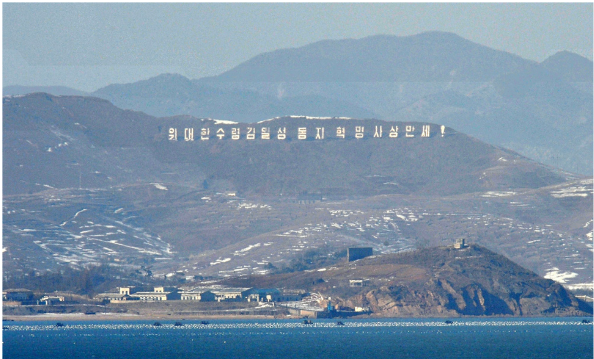
Пограничные территории западного побережья Северной Кореи, на котором видны многочисленные военные бункеры и надпись «Да здравствует Ким Ир Сен и его революционная идеология!» Фото сделано с острова Йонпхендо 28 января.