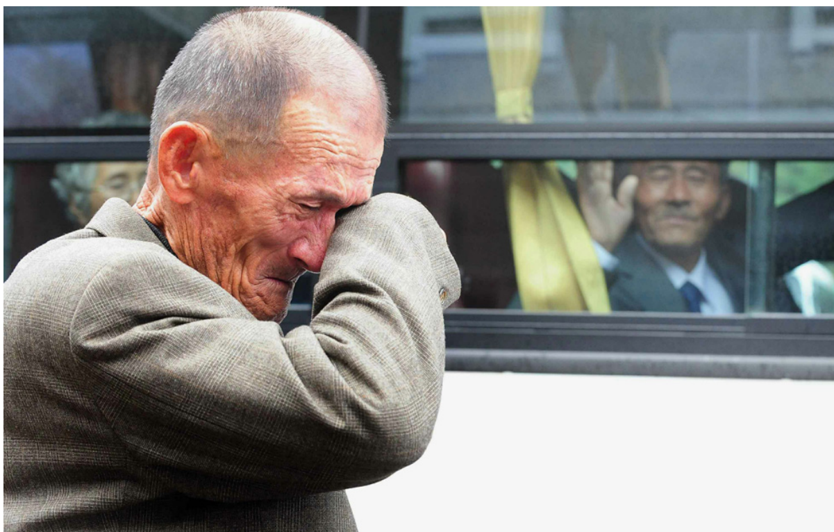
Пожилой житель Южной Кореи вытирает слезы, прощаясь со своим северокорейским родственником (в автобусе) после встречи разьединенных семей на курорте на горе Кымган, недалеко от границы между Кореями 31 октября. Северная Корея раскритиковала Южную за этот план о воссоединении семей и заявила, что Сеул сам спровоцировал эту атаку на остров.