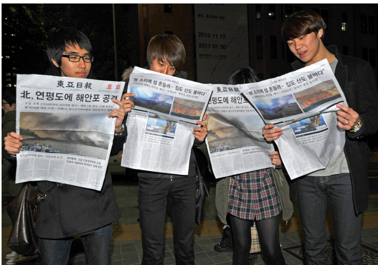
Южнокорейцы читают специальный выпуск газеты в центре Сеула.