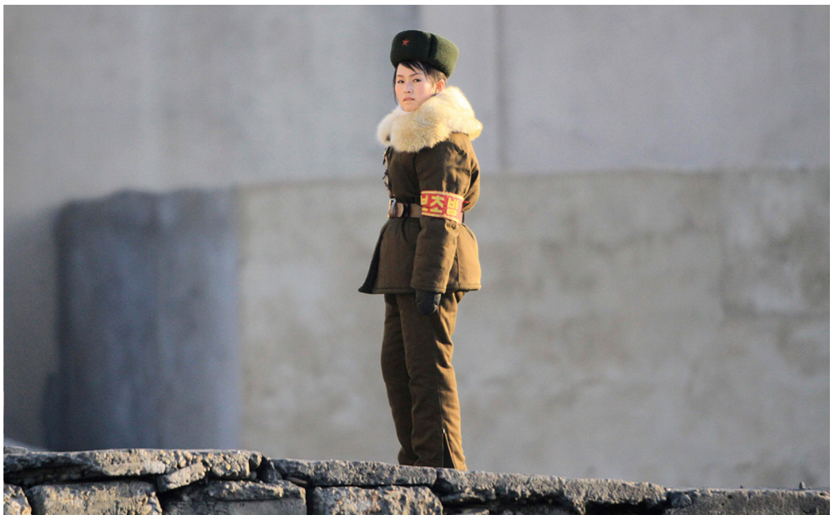
Северокорейская девушка-солдат охраняет берега реки Ялуцзян, недалеко от северокорейского города Синьджу, напротив китайского города Даньдун.