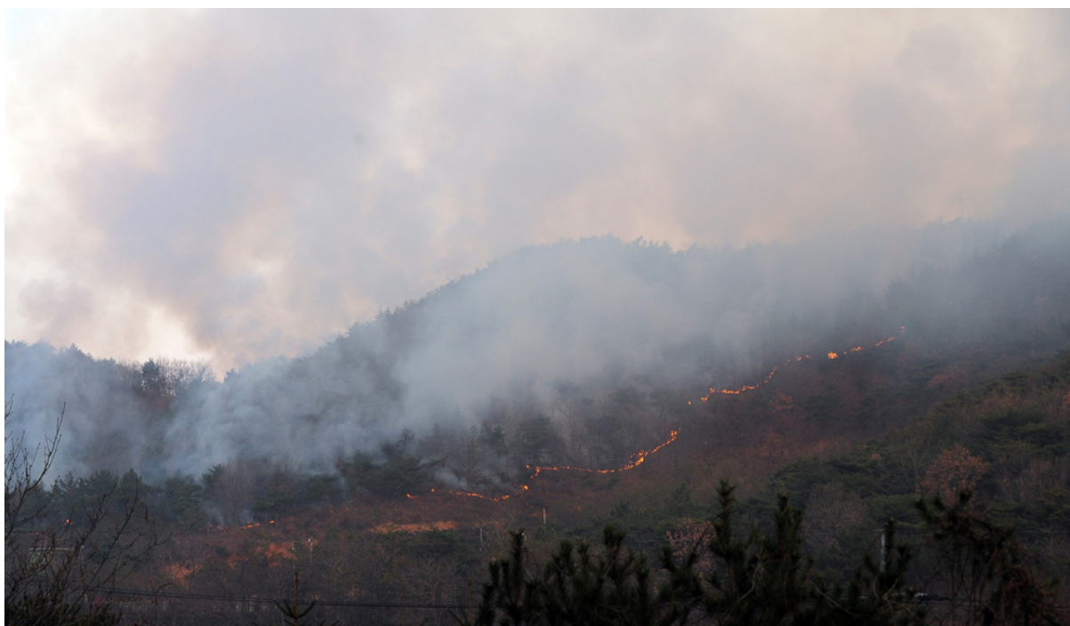
Столбы дыма поднимаются в воздух от лесного пожара 24 ноября.