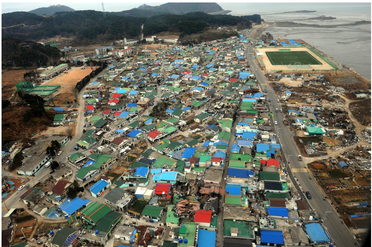
Разрушенные дома на острове Йонпхендо.