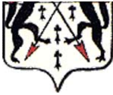
Герб 18-го века