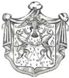
Герб 1917 года