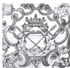
Герб 1690 года