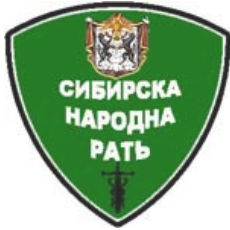
Сибирска Народна Рать