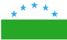
Проект флага Сибири