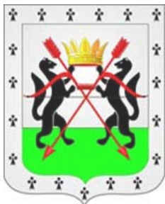
Герб Сибирского Соглашения