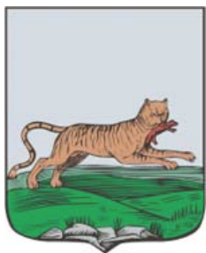
Герб Иркутска 1690 год