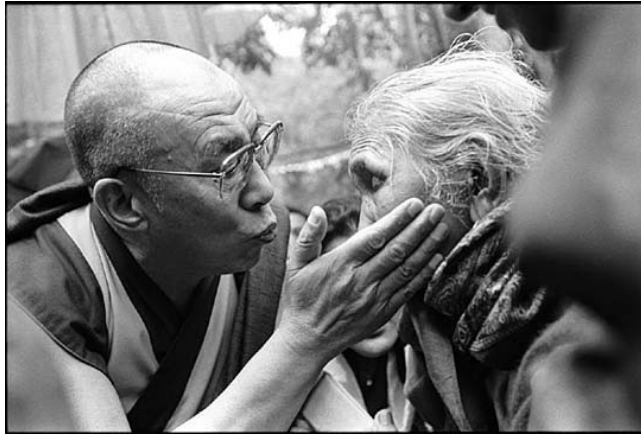
Монастырь Туптен Дорджи Дак, Касумпти, Химачал Прадеш, Индия. 16 июня 2002

Я хочу сказать вам, что самое важное — это преобразование ума, обретение нового образа мыслей, нового мировоззрения. Мне кажется, нам нужно приложить усилие, чтобы преобразовать свой внутренний мир. На протяжении веков, на протяжении жизни многих поколений человечество направляло огромные усилия на развитие общества в материальном отношении, опираясь на науки и технологии. На мой взгляд, сегодня мир в целом и, в особенности западные страны, достигли очень высокого уровня жизни. Однако и у этих стран по-прежнему много проблем, прежде всего с преступностью и жестокостью. В Англии, Америке и других странах молодые люди порой стреляют друг в друга безо всякой на то причины. А в области международных отношений страны, которые высоко ценят свободу, демократию и права человека (даже такие как Америка или государства Западной Европы), все еще в значительной степени опираются на применение силы.