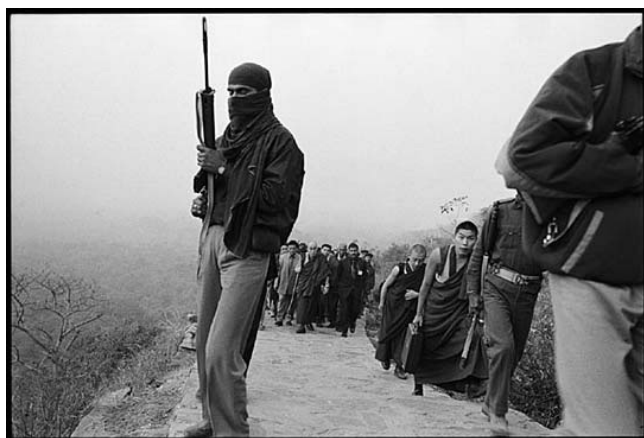
Гора коршунов, Раджгир, Бихар, Индия. 14 января 2002

Другая серьезная проблема — загрязнение окружающей среды. Проводить конференции по этой теме в разных странах очень полезно, но, помимо этого, также необходимо эффективно претворять в жизнь принятые решения. Опять же, на мой взгляд, этот вопрос непосредственно связан с уровнем жизни. В Америке, например, а также здесь, в Лондоне, на дорогах очень много машин, но большинство из них перевозит не более одного человека. Похоже, почти у каждого есть машина, а в некоторых семьях — по два-три автомобиля. А теперь представьте себе Китай с населением свыше двух миллиардов или Индию с населением в 900 миллионов. Если они последуют этой модели, то это будет означать появление около трех миллиардов машин только в этих двух странах. Это чревато большими трудностями.