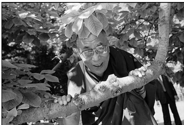
Пражский замок, Прага, Чехия. 3 июля 2002

Братья и сестры! Для меня огромная честь быть здесь с вами сегодня и выступить перед вами. Я хочу воспользоваться этой возможностью, чтобы выразить свою признательность фонду «Tibet House Trust» за