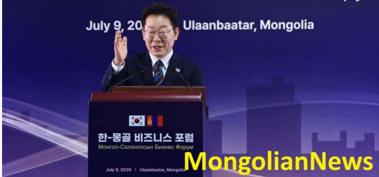
Президент Южной Кореи Ли Чжэ Мён

Кроме того, южнокорейские технологические гиганты претендуют на монгольские ископаемые ресурсы. Вместе с Ли Чжэ Мёном в Улан-Батор прилетели председатель LS Holdings Ку Чжа Ын и глава POSCO Holdings Чан Ин Хва.