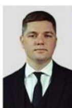
Черников Александр Игоревич Министр промышленности и торговли Красноярского края

Итак, 1 июля 2026 года в краевом правительстве произошла неожиданная замена министра промышленности. Произошло это на фоне бензинового кризиса, охватившего страну.