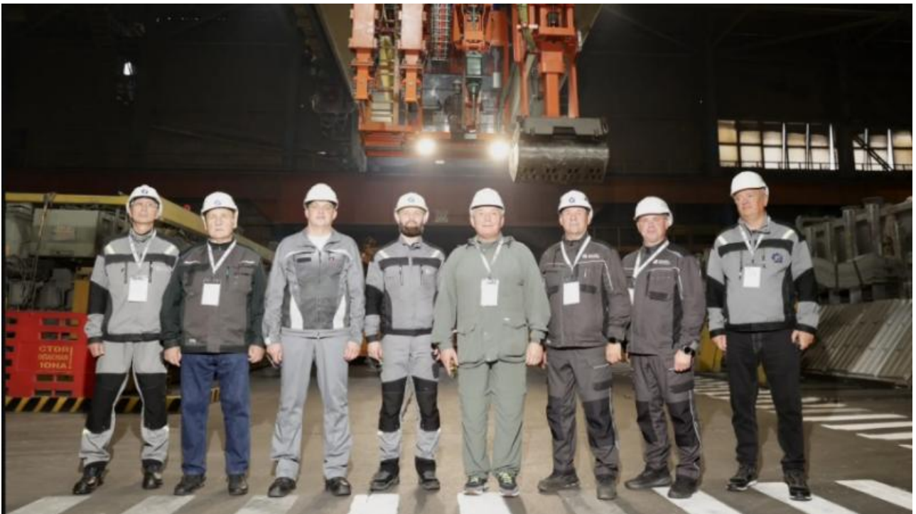
Фото: Артём Моисеев

Автор: Ярослава Грин © Babr24.com НАУКА И ТЕХНОЛОГИИ, ИРКУТСК 👁 18 08.07.2026, 13:06