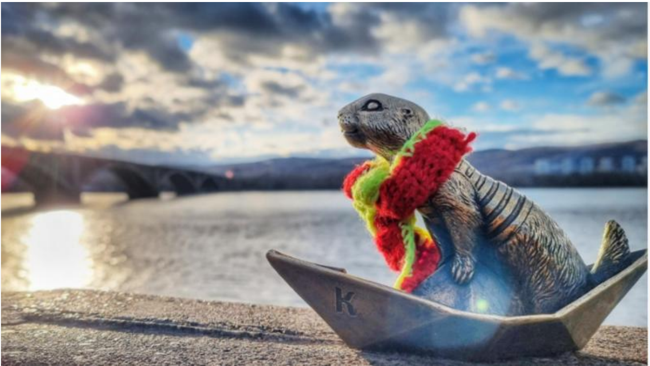
Суслик Крас. Самая первая бронзовая фигурка

Бабр уже делился с читателями историей появления зверьков, но стоит напомнить, что изначально их планировалось всего десять. Сусликов специально расположили в разных пространствах с буквами, которые в правильном порядке складывались в слово «Красноярск». Так прогулка превратилась в увлекательный квест: найти всех героев и собрать слово.