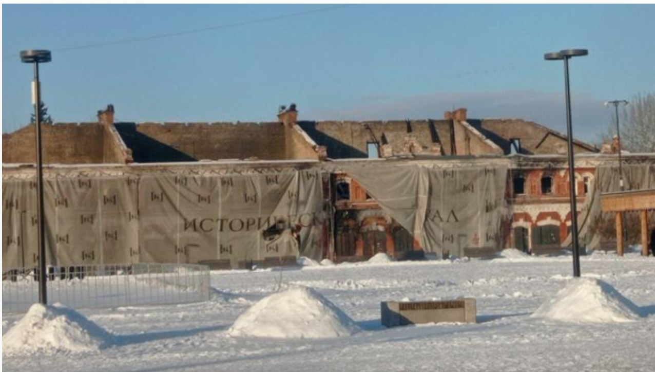
Второй корпус после пожаров

Так как состояние первого корпуса существенно лучше, в предстоящей реконструкции ограничатся только им.