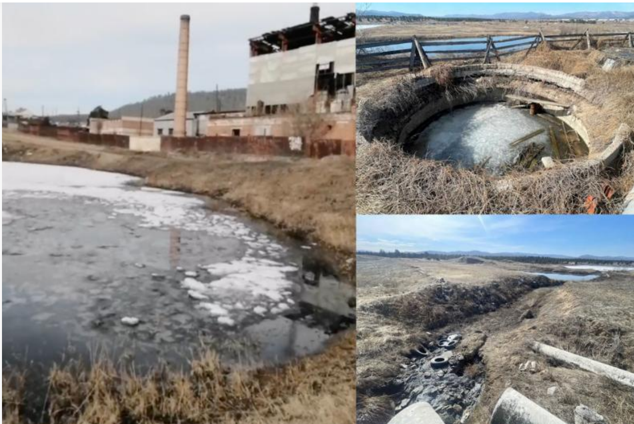
Отстойник в Заиграево и слив нечистот в Новой Бряни

В селе Новая Брянь вообще канализационные стоки сливают прямо на открытый грунт из-за отсутствия очистных. Хотя сброс таких отходов в водоёмы и грунт запрещён законодательством. Ещё в 2020-2021 годах по этому поводу были вынесены судебные предписания, которые до сих пор не исполнены.