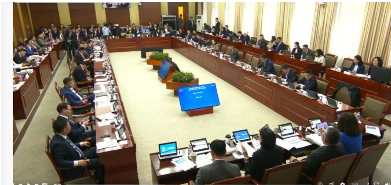
Зал заседаний Государственного дворца во время публичных слушаний по бюджету Улан- Батора

Аудиторы и депутаты вскрыли масштабные хищения, фальшивые финансовые гарантии и подкуп народных избранников.