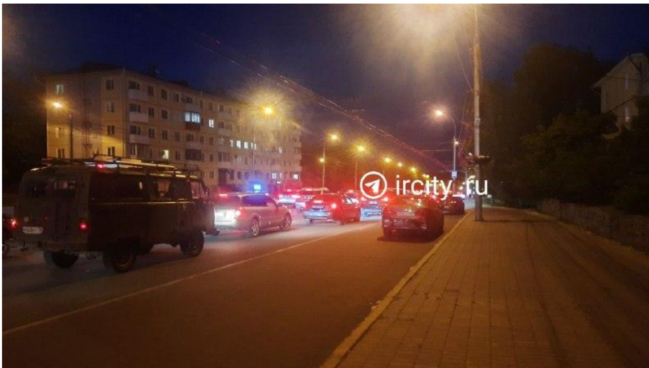
Фото: ИА «ИрСити»

Автор: Алина Саратова © Babr24.com ПРОИСШЕСТВИЯ, ТРАНСПОРТ, ИРКУТСК 👁 45 26.06.2026, 10:05