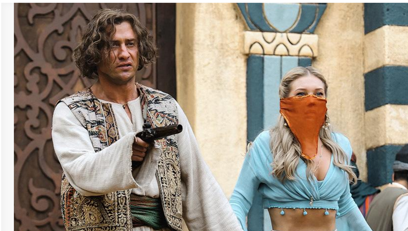
Кадр из фильма «Холоп 3»

Третье место сохранило за собой «Закулисье реальности», пополнившее копилку на 72,6 миллиона с потерей в сборах 43 % и второй посещаемостью в топ-10: 17 зрителей за сеанс. Общие сборы триллера ужасов Кейна Парсона преодолели на уикенде знаковую отметку в 500 миллионов рублей.