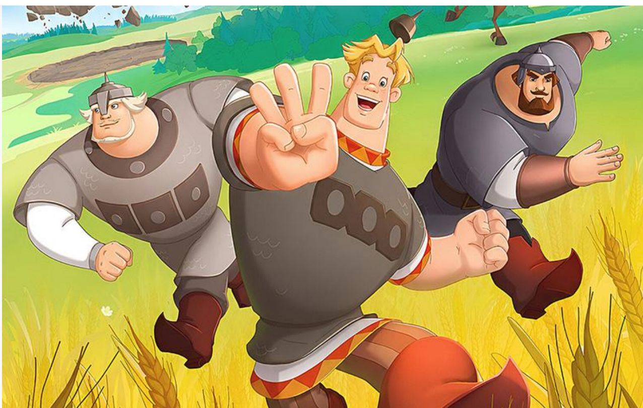
Постер к фильму «Три богатыря. Ни дня без подвига 3»