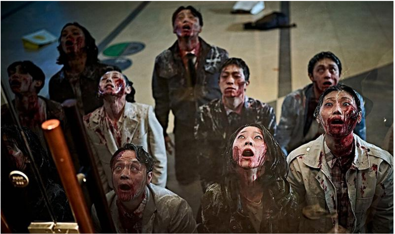
Кадр из фильма «Колония»