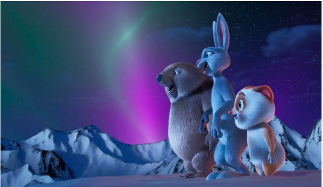
Кадр из фильма «Зверолюция»

Общая касса топ-20 фильмов уикенда составила 640,3 миллиона рублей. Это на 26,49 % меньше по сравнению с предыдущими выходными .