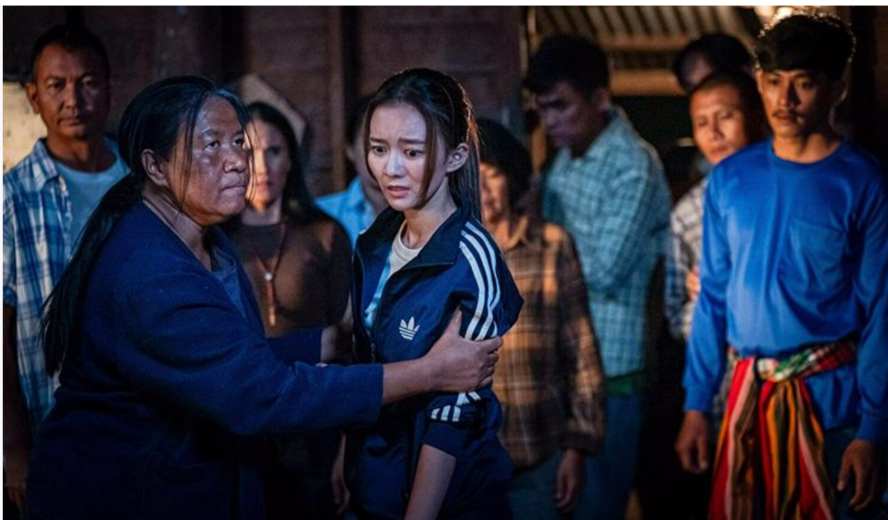
Кадр из фильма «Астрал. Проклятие экзорциста»