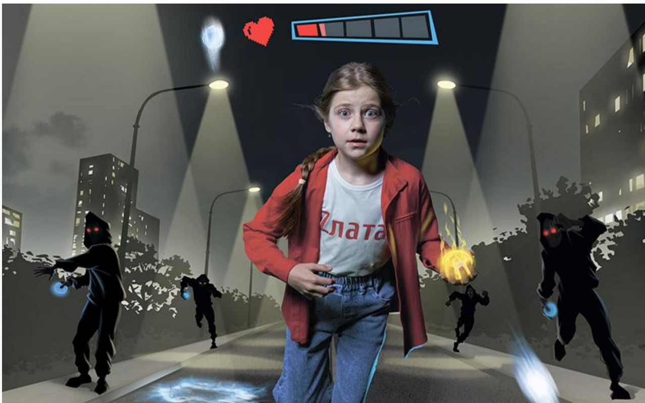
Постер к фильму «Летом всякое бывает. Побег из Сколбора»