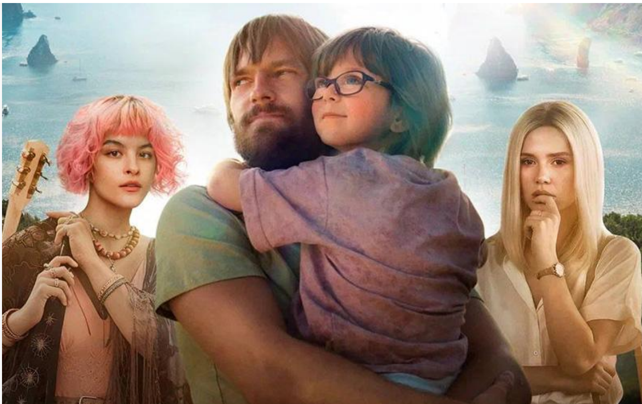
Постер к фильму «Где ты?»

и прах» (18+), тайландский хоррор Тавивата Вантхи «Астрал. Проклятие экзорциста» (18+), документальный фильм Софии Копполы о модельере Марке Джейкобсе «Марк глазами Софии» (18+) и первые эпизоды аниме-сериала Моко-тяна «Призрак в доспехах» (18+).