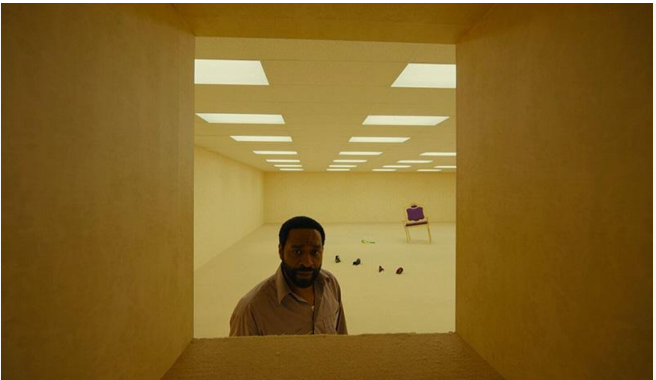
Кадр из фильма «Закулисье реальности»

Две лучшие новинки уикенда дружно привлекли в кинозалы в среднем по десять зрителей за сеанс.