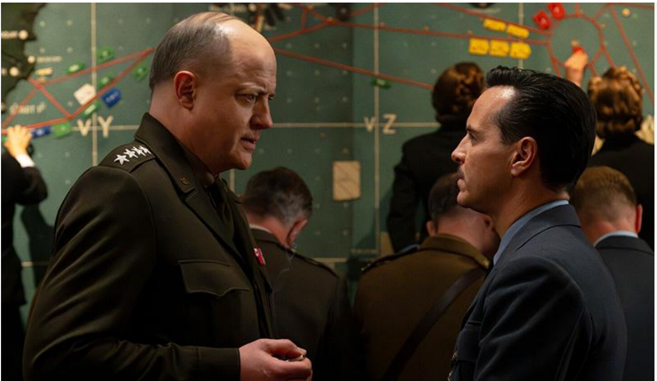
Брендан Фрейзер и Эндрю Скотт в фильме «Давление»

Вместе с тремя лидерами проката места в топовой десятке сохранили «Обсессия» (32 миллиона с потерей в сборах 24 % и пятое место), «Зверолюция» (18,6 миллиона с потерей в сборах 45 % и седьмое место), «Грязные деньги» (12,5 миллиона с потерей в сборах 57 % и восьмое место) и «Дени и Мэни в кино!» (10,2 миллиона с потерей в сборах 58 % и девятое место).