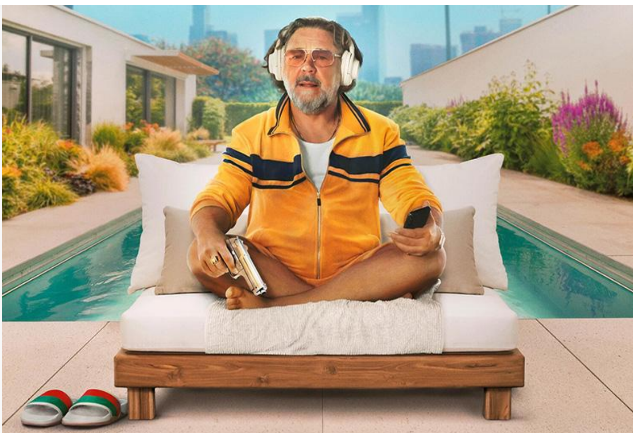
Постер к фильму «Ночной бизнес»