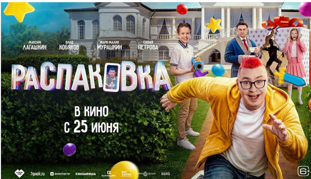
Постер к фильму «Распаковка»