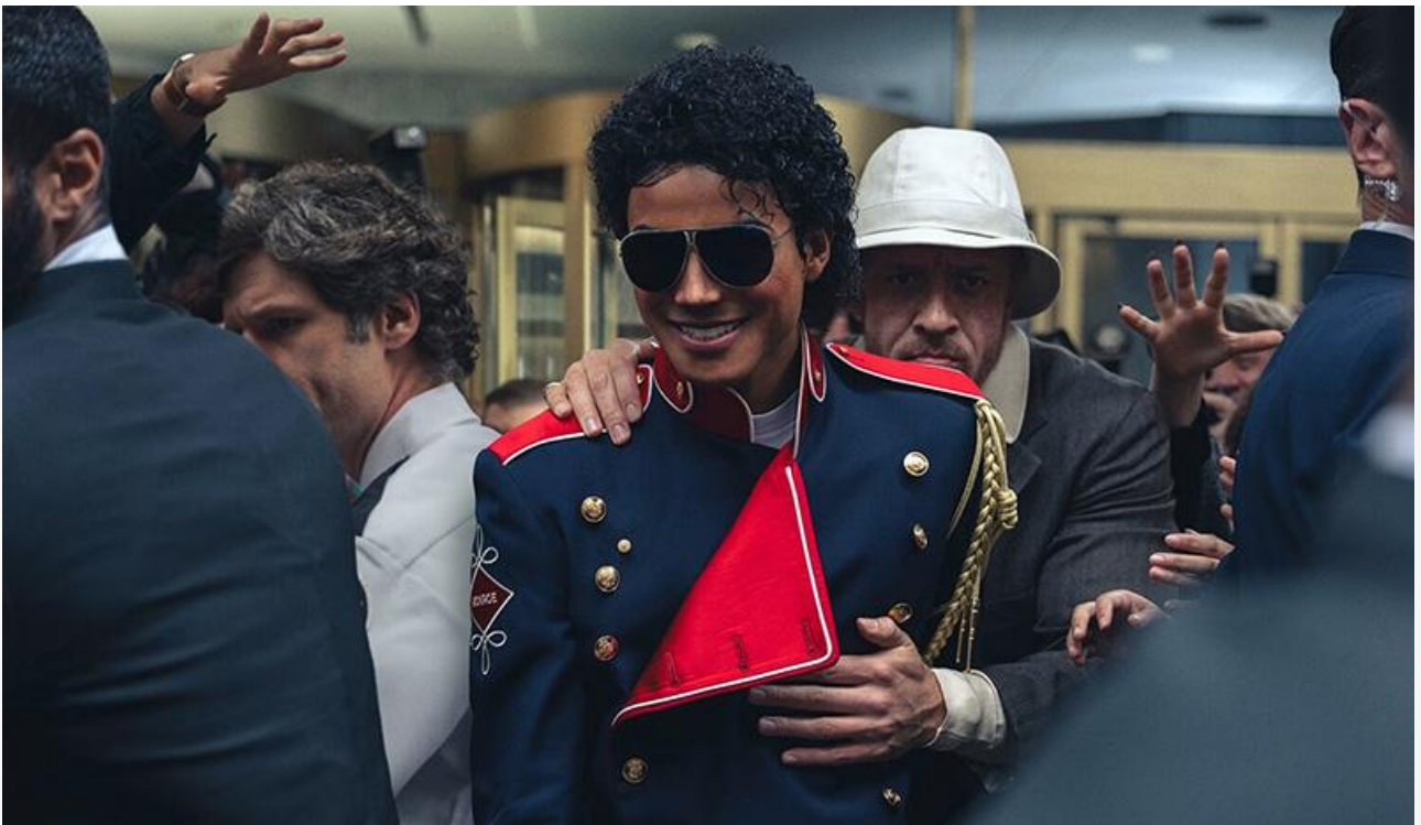
Кадр из фильма «Майкл»