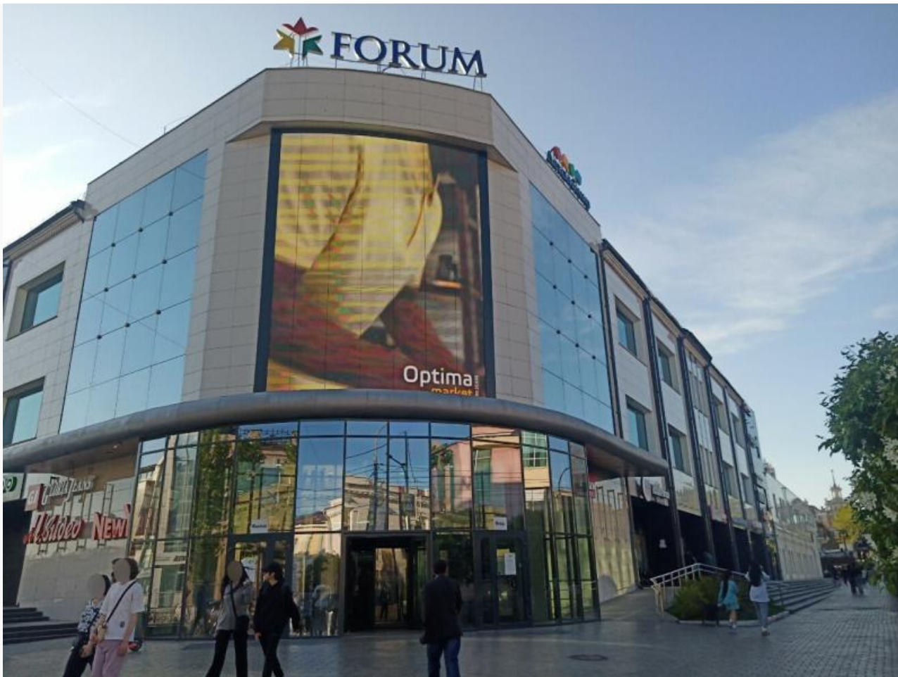
Торгово-развлекательный центр «Форум»