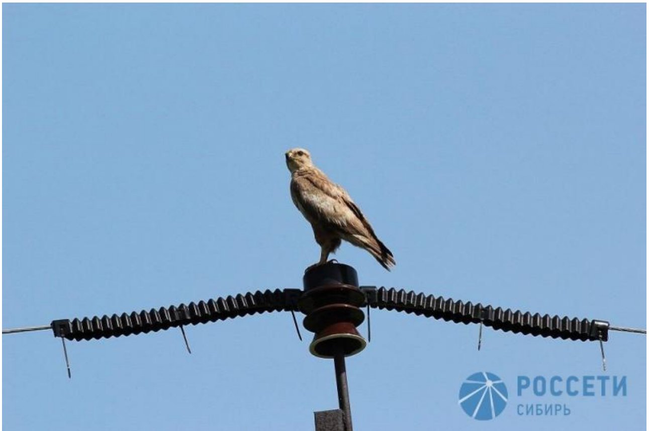
Фото: Андрей Коваленко, ПАО «Россети Юг»

Автор: Валерий Лужный © Babr24.com БРАТЯ МЕНЬШИЕ, КОРПОРАЦИИ, ЭКОЛОГИЯ, КРАСНОЯРСК 24.06.2026, 17:31 👁 25