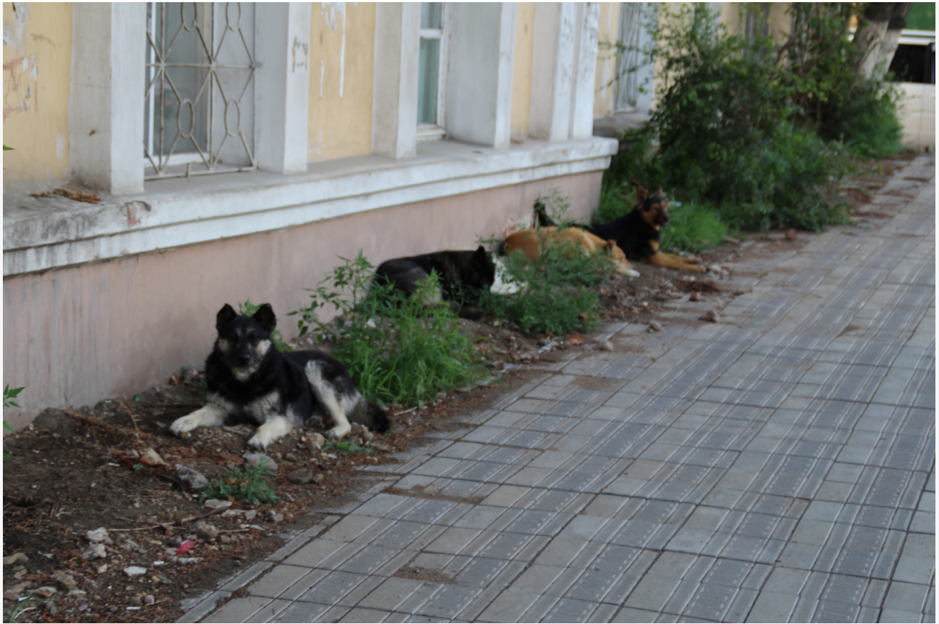
Автор: Алёна Штерн Фото из альбома "Бродячие собаки" © Фотобанк "RuVabr"

С 1 марта 2026 года изменения достигли и Красноярья. Власти долго откладывали законопроект, несмотря на частые жалобы жителей о нападениях. Но трагедия в Берёзовском районе поставила точку в размышлениях. Напомним, что 25 октября 2025 года стая из десяти бродячих собак насмерть загрызла десятилетнего мальчика в районе садоводческого товарищества «Теремок».