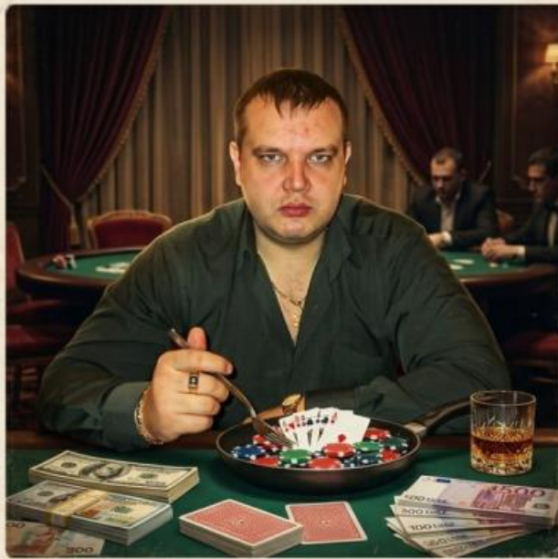
ВОРОТИЛА ИГОРНОГО БИЗНЕСА