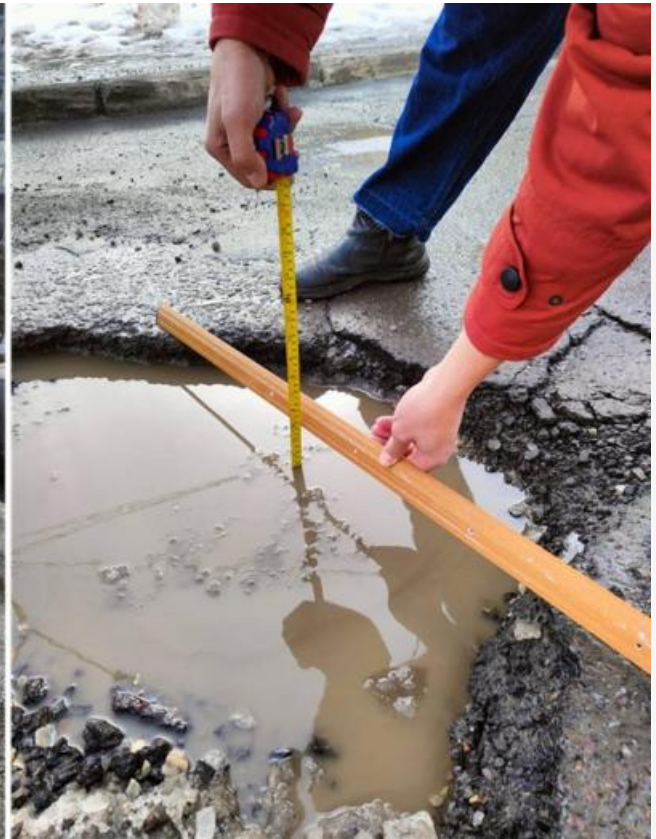
Апрель 2025 года

История с улицей Нефтяной — далеко не первый пример, когда городские власти откладывают решение дорожных проблем, ограничиваясь временными мерами. Ранее Бабр писал о ситуации на улицах Тургенева и Энтузиастов, где мэрия решила бороться с разрухой с помощью технологических карт вместо полноценной реконструкции. При этом капитальный ремонт улицы Тургенева не проводился с 1975 года, а сроки её обновления неоднократно переносились. Как и в случае с Нефтяной, власти объясняют затягивание работ нехваткой финансирования и ожиданием областной поддержки.