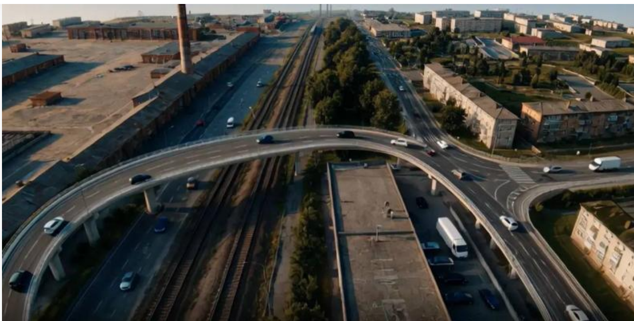
Нейросетевое изображение будущей развязки у микрорайона Горького

Местные паблики мгновенно отреагировали на эту халтуру, задавшись вопросом: почему авторитетный институт с миллиардными оборотами сдаёт столице Бурятии копеечные рисунки из нейросетей?