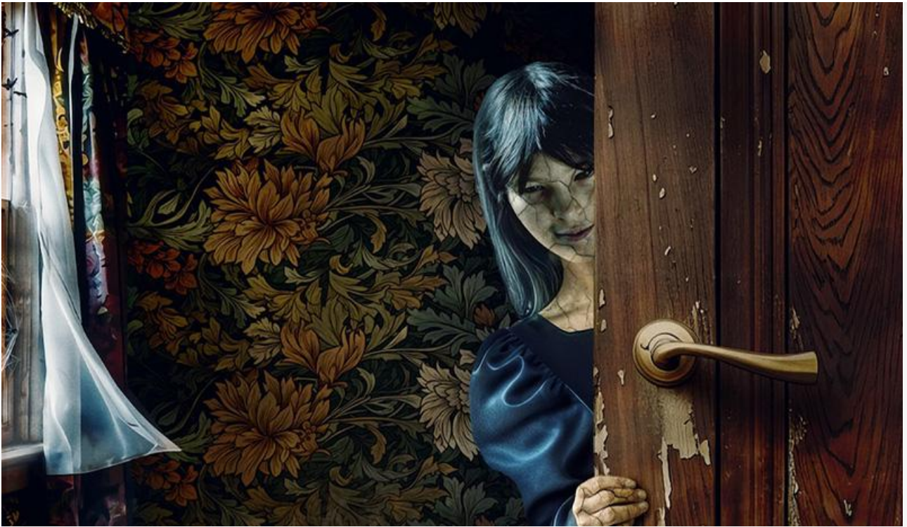
Постер к фильму «Омен. Обличье зла»