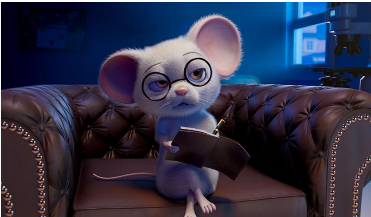
Кадр из фильма «Зверолюция»

В шаге от топ-10, на одиннадцатом месте, завершил стартовый уикенд хоррор Баима Вона « Зеркала. Пожиратели душ »: 361 экран, 1,1 тысячи сеансов, восемь зрителей за сеанс и 4,6 миллиона рублей.