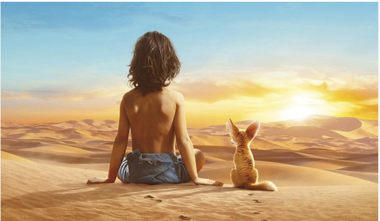
Постер к фильму «Мальчик и лис»