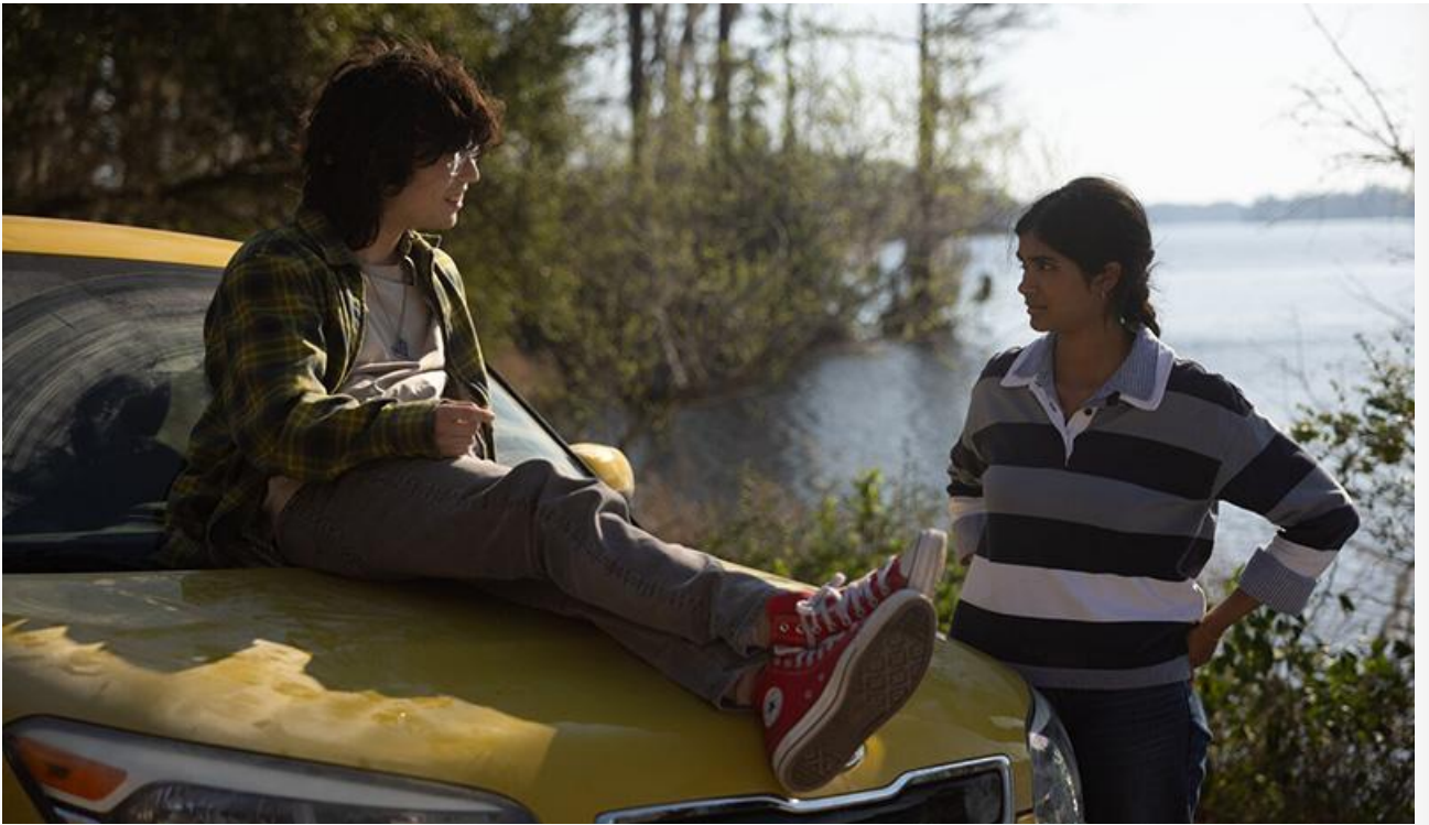
Кадр из фильма «Драйв»