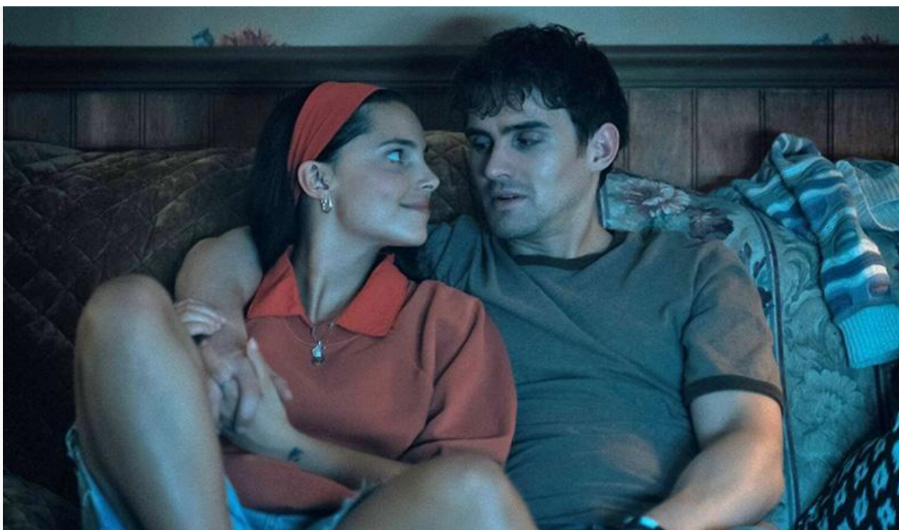
Кадр из фильма «Обсессия»