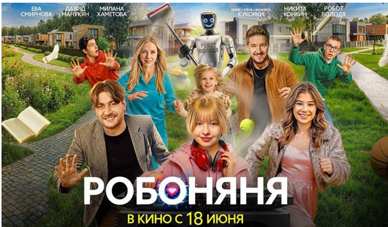
Постер к фильму «Робоняня»

С большой вероятностью пробьётся в топ-10 и южнокорейский фильм ужасов Ён Сан-хо «Колония» (18+) от создателей культового «Поезда в Пусан».