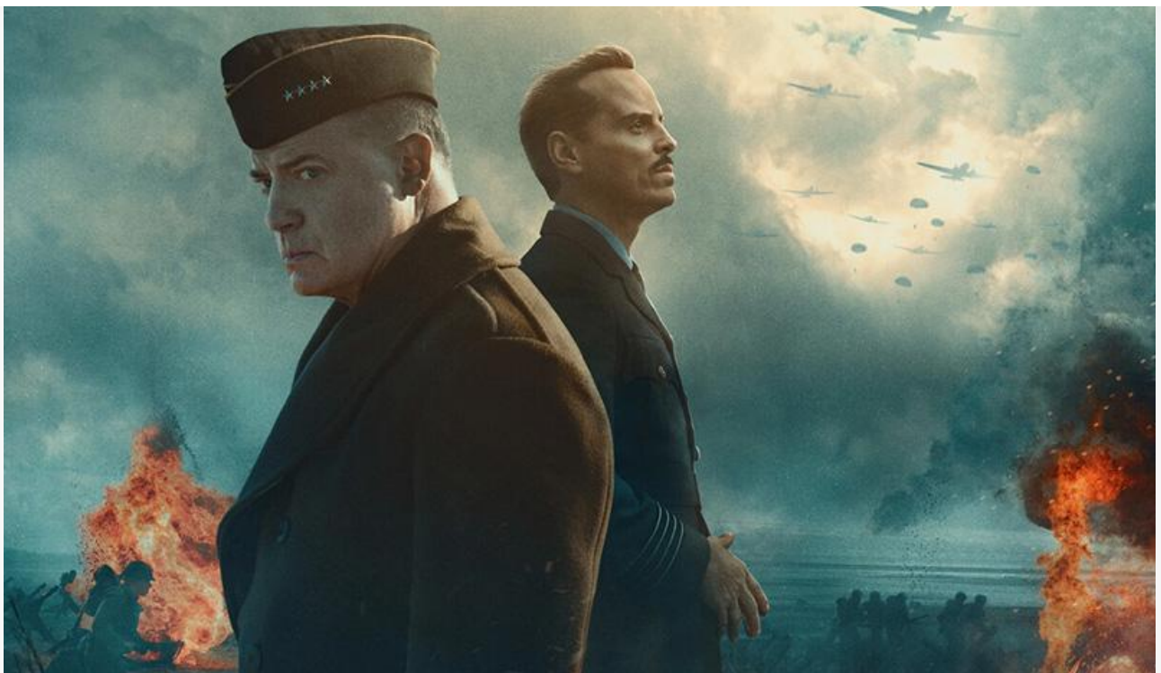
Постер к фильму «Давление»