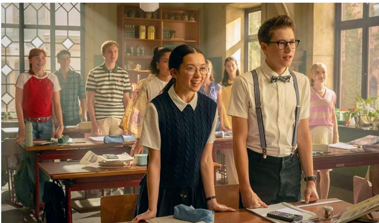
Кадр из фильма «Школа магических зверей. Хранители чуда»

Лидер двух предыдущих уикендов – музыкальный байопик « Майкл » – потерял в сборах по сравнению с прошлыми выходными минимальные 6 % и с прибылью 233,5 миллиона опустился на вторую строку чарта.