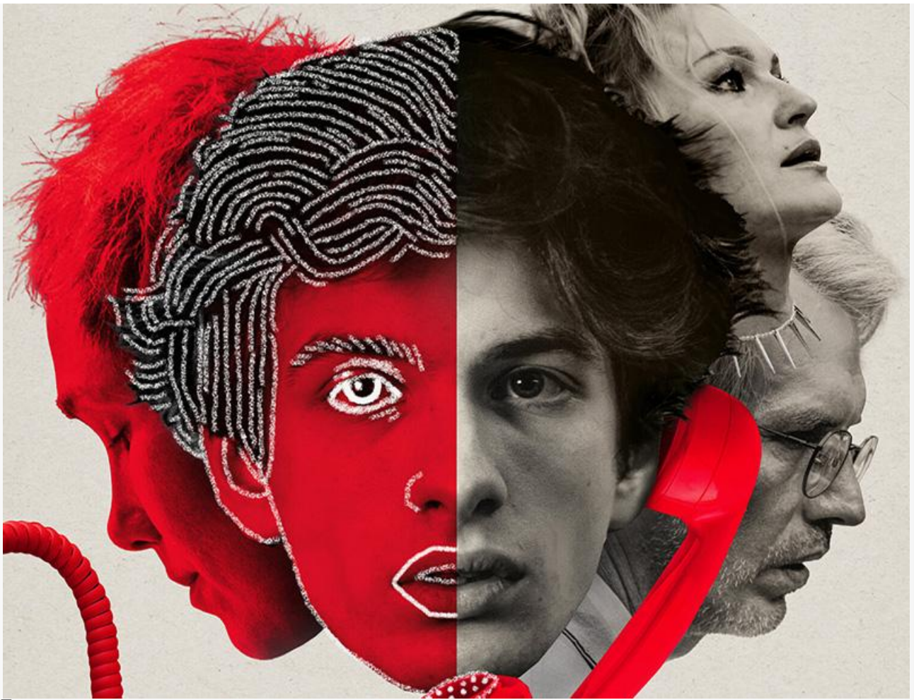
Постер к фильму «Ганди молчал по субботам»