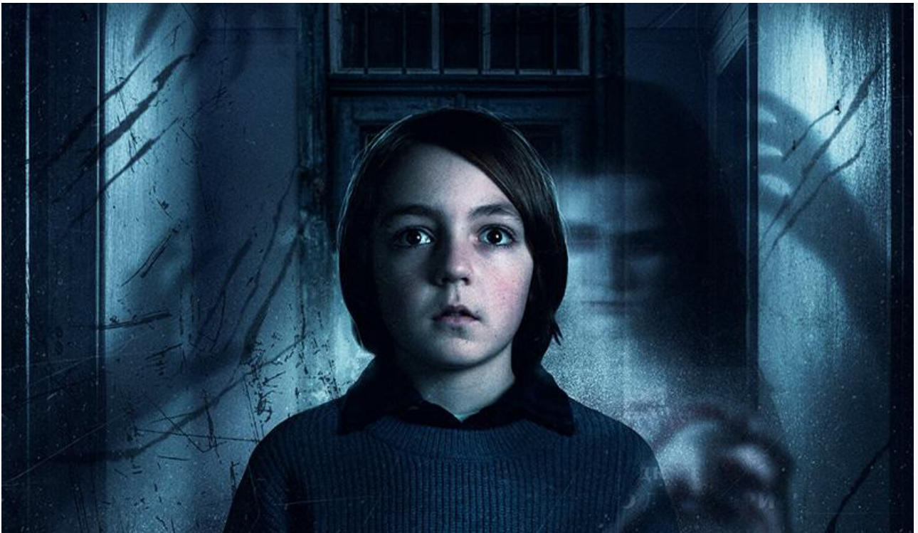
Постер к фильму «Оно. Ночной кошмар»

Также выходят на экраны американская экшн-комедия Бобби Фаррелли «Драйв» (18+), франко-бельгийская семейно-приключенческая лента Жюль де Мэтра «Мальчик и лис» и аниме Томохико Ито «Хранитель камфорного дерева» .