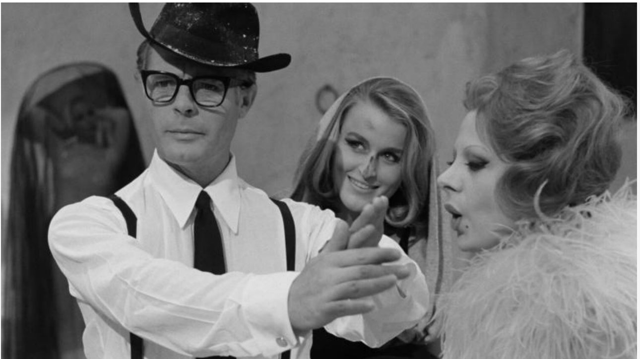
Кадр из фильма «Восемь с половиной»