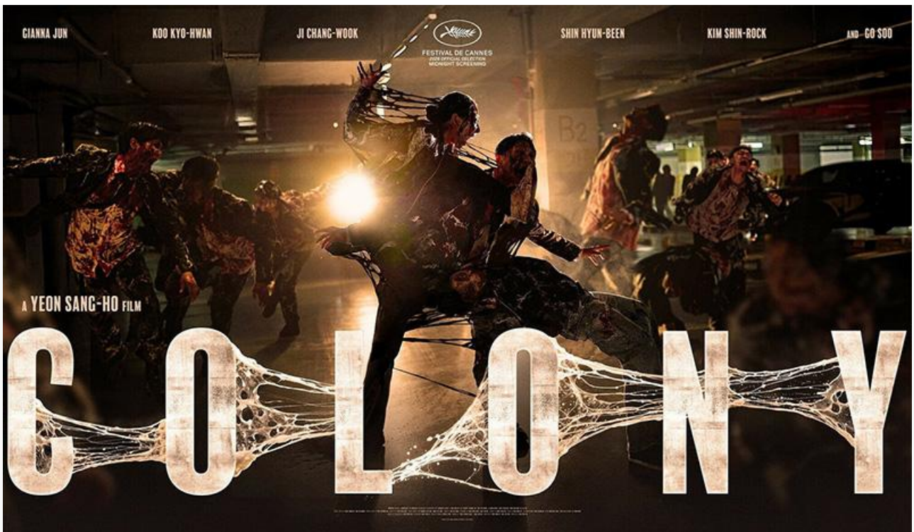
Постер к фильму «Колония»