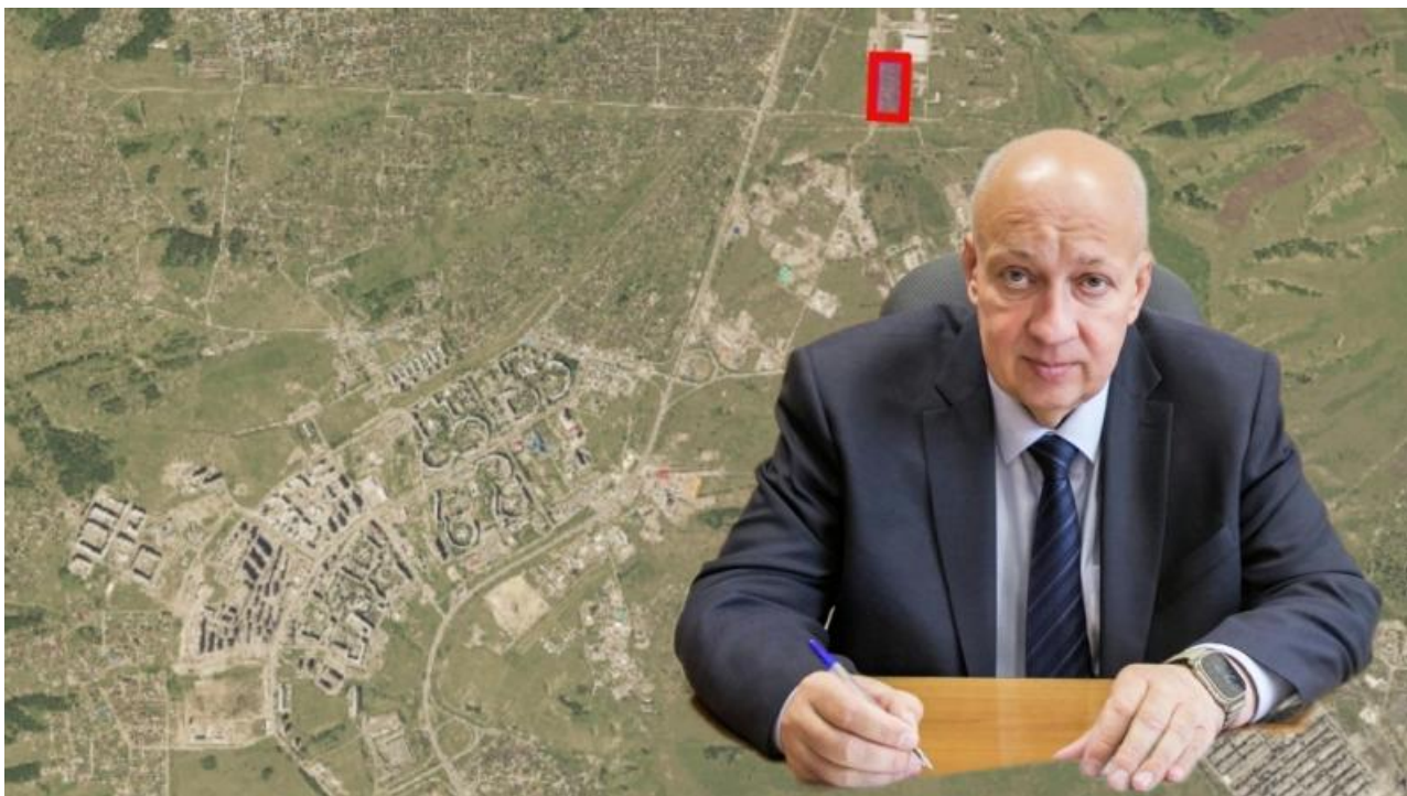
Фото: Енджиевский/ВКонтакте, Заксобрание края

Автор: Валерий Лужный © Babr24.com НЕДВИЖИМОСТЬ, ПОЛИТИКА, СКАНДАЛЫ, КРАСНОЯРСК 17.06.2026, 17:18 👁 124