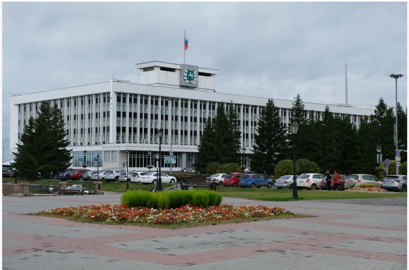
Автор: Алёна Штерн Фото из альбома