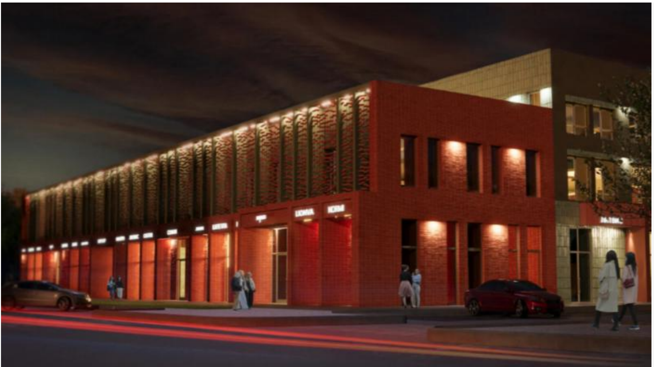
Проект обновлённого комбината