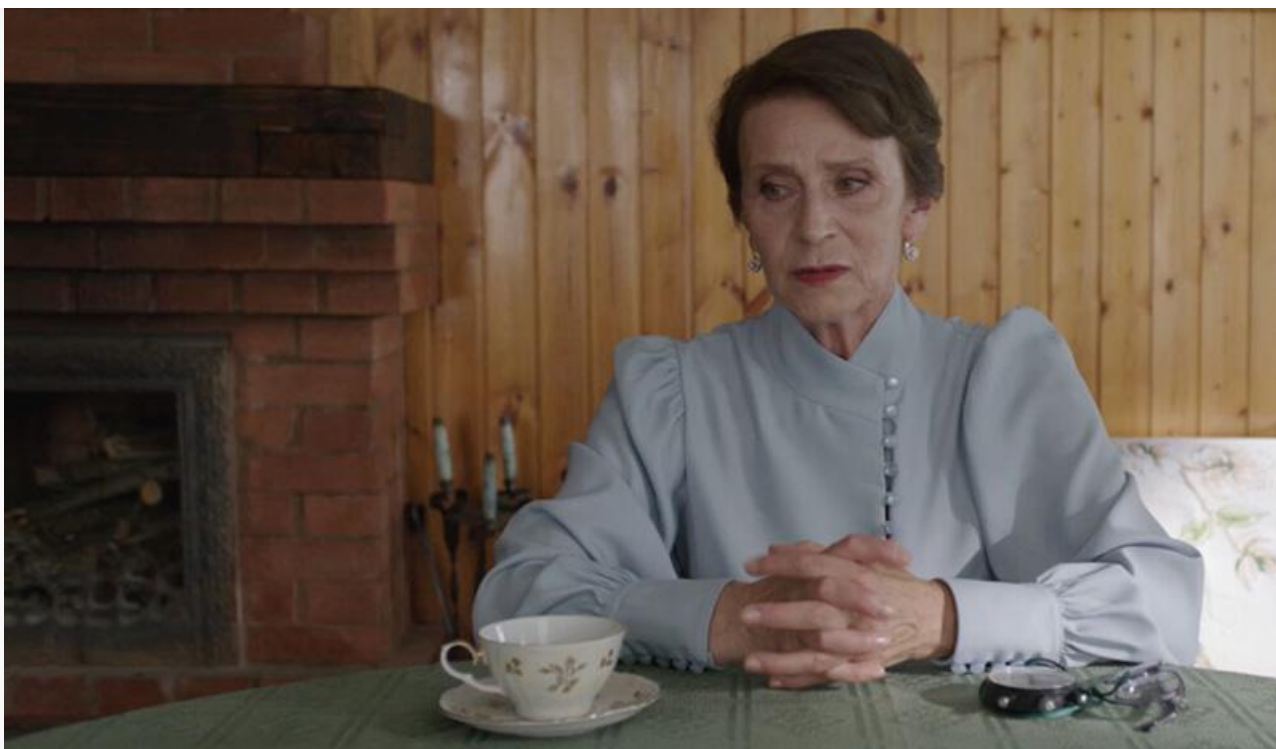
Нина Владимировна в фильме «Великий и могучий», 2025 год