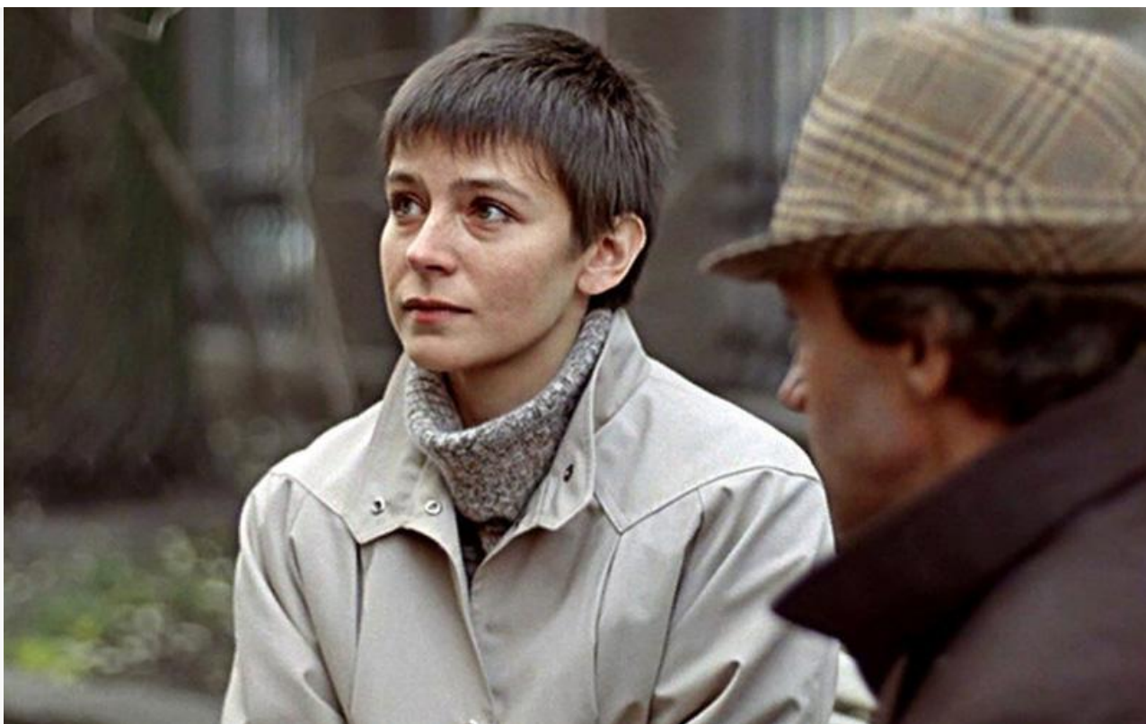
Ольга в фильме «Зимняя вишня», 1985 год

В 1990 году зрители увидели сиквел любимой мелодрамы – «Зимняя вишня 2», а в 1995-м – «Зимнюю вишню 3» и восьмисерийную телеверсию всей трилогии.