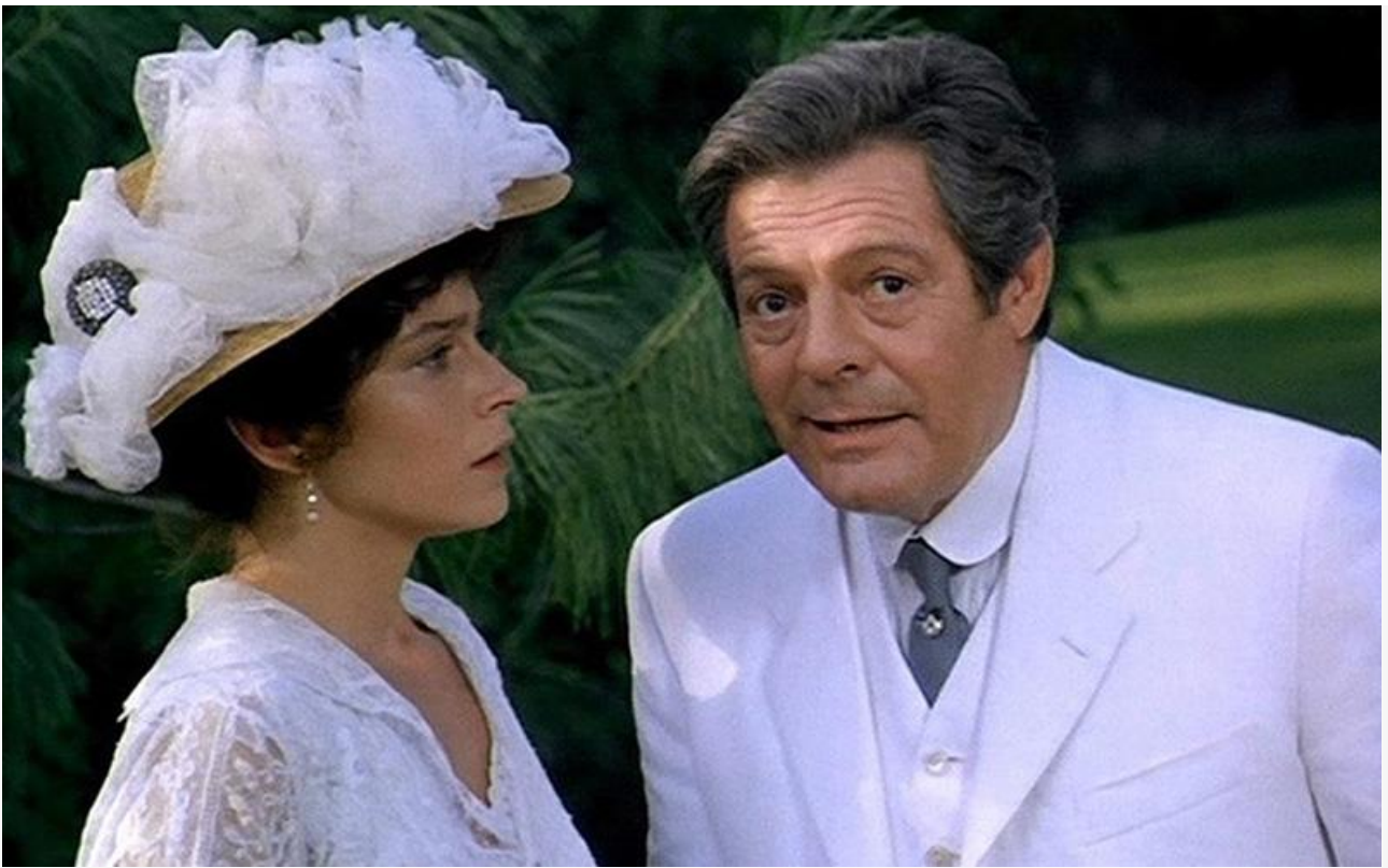
Анна Сергеевна в фильме «Очи чёрные», 1987 год

На сегодняшний день Елена Сафонова сыграла более 110 ролей в фильмах и телесериалах. Среди них – Хильда Трелони Хоуп в детективе Игоря Масленникова «Приключения Шерлока Холмса и доктора Ватсона: Двадцатый век начинается», Алла в комедии Геральда Бежанова «Где находится нофелет?», Анна в криминальной мелодраме Сергея Бодрова и Александра Буравского «Катала», Нина в драме Павла Лунгина «Такси-блюз», Нина Шереметева в мелодраме Виллена Новака «Принцесса на бобах», Елизавета Каминская в мелодраме Дмитрия Месхиева «Женская собственность», Александра в триллере Николая Лебедева «Поклонник».