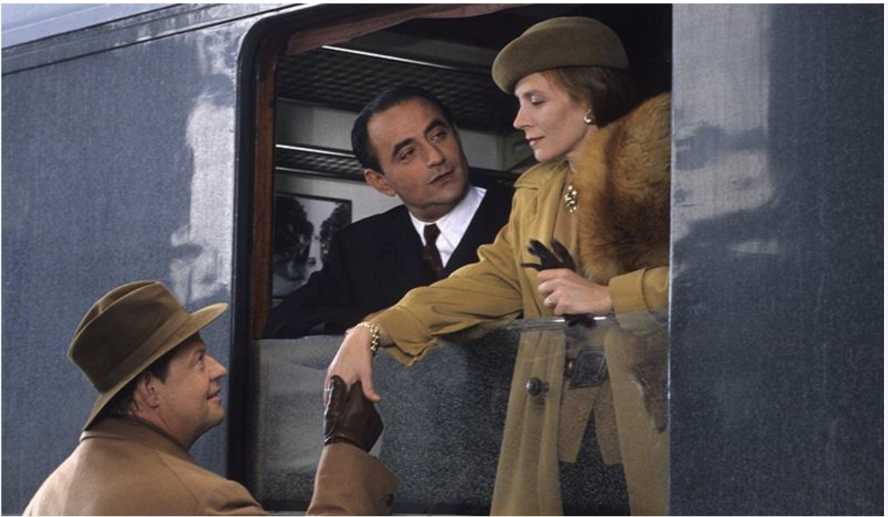
Ирен Брайс в фильме «Аккомпаниаторша». Франция, 1992 год