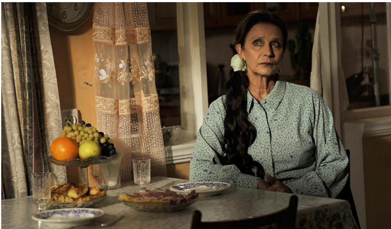
Арина Ивановна в фильме «Бабуля», 2022 год