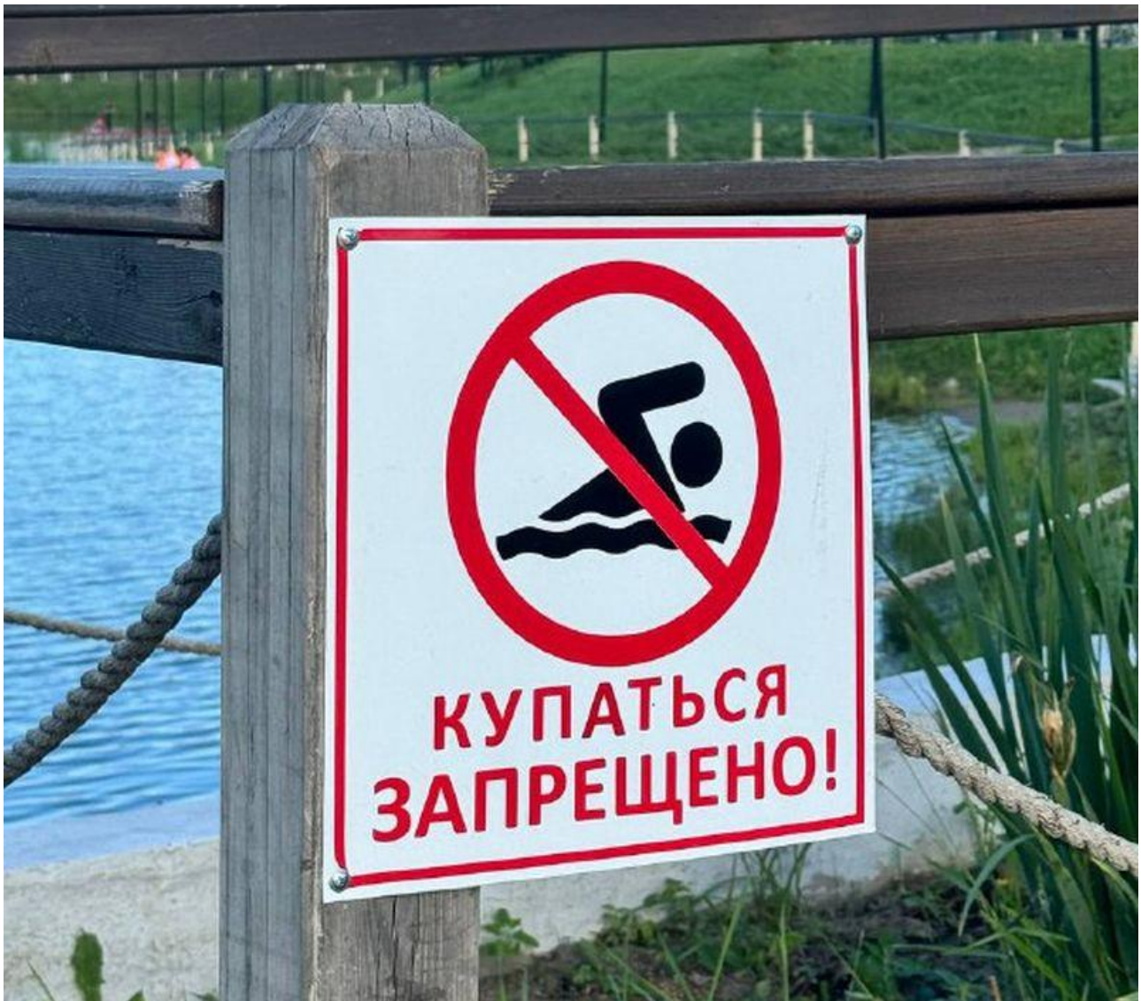
Фото: канал ГУ МВД России по Иркутской области

Автор: Алина Саратова © Babr24.com ОБЩЕСТВО, ЭКОЛОГИЯ, ИРКУТСК 👁 505 13.06.2026, 13:11