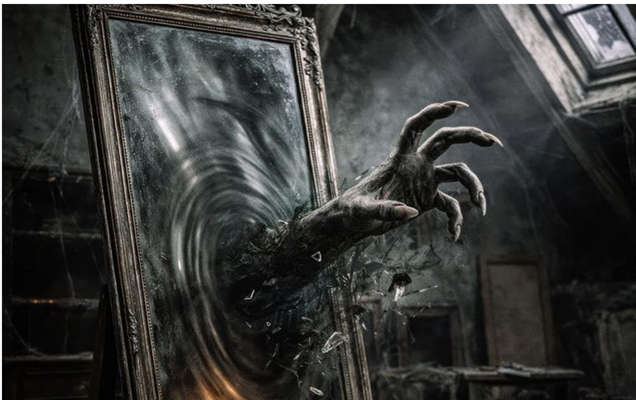
Постер к фильму «Зеркала. Пожиратели душ»