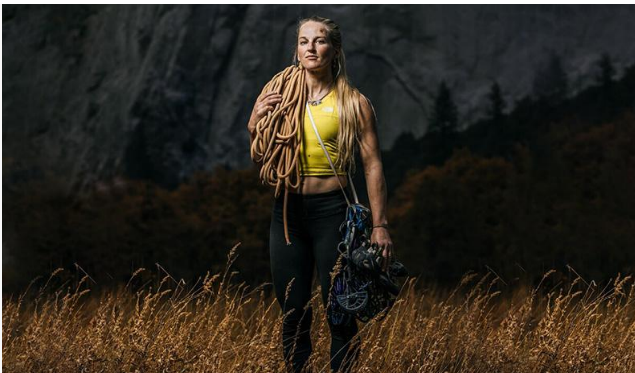
Постер к фильму «Цена вершины»