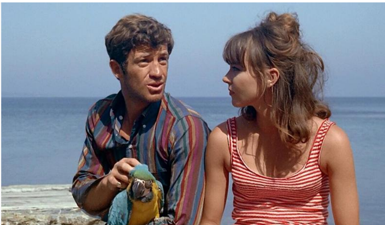
Кадр из фильма «Безумный Пьеро»

Также выходит на экраны австрало-американский документальный фильм о скалолазке Эмили Харрингтон « Цена вершины ».