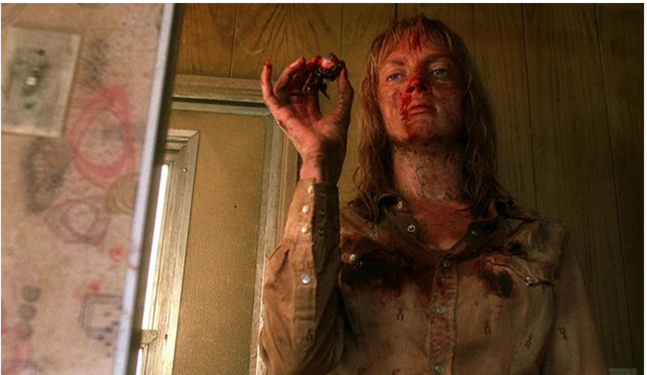
Ума Турман в фильме «Убить Билла: Кровавое дело целиком»

Из старожилов проката кроме лидера места в топовой десятке сохранили «Грязные деньги» (47,1 миллиона с потерей в сборах 55 % и третье место), «Обсессия» (38,1 миллиона с потерей в сборах 14 % и пятое место), «Не одна дома 3. Выпускной» (28,2 миллиона с потерей в сборах 53 % и шестое место), «Кощей. Тайна живой воды» (22 миллиона с потерей в сборах 50 % и седьмое место), «Пропась» (11,8 миллиона с потерей в сборах 54 % и восьмое место) и «Богатыри» (7,9 миллиона с потерей в сборах 69 % и десятое место).