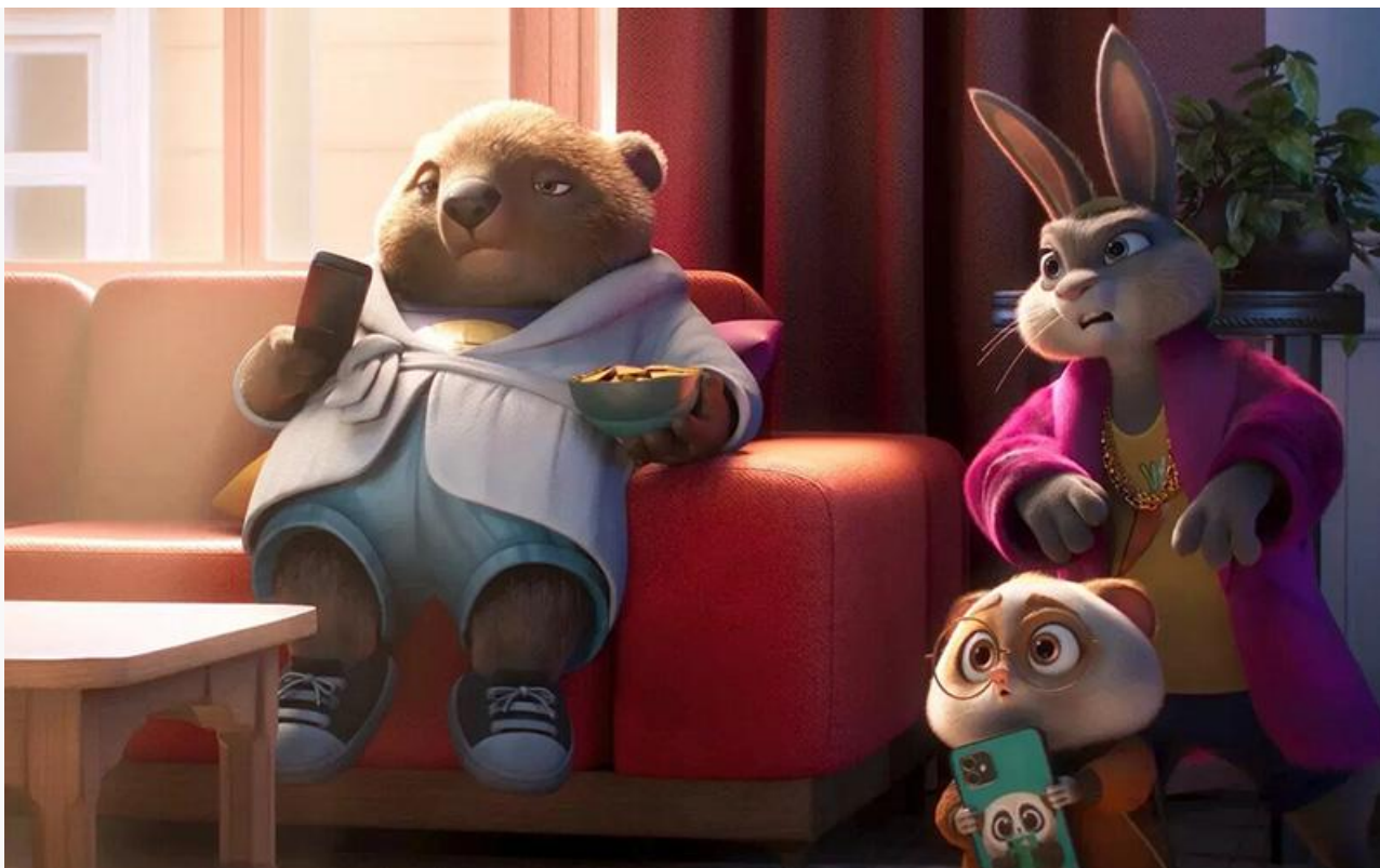
Кадр из фильма «Зверолюция»