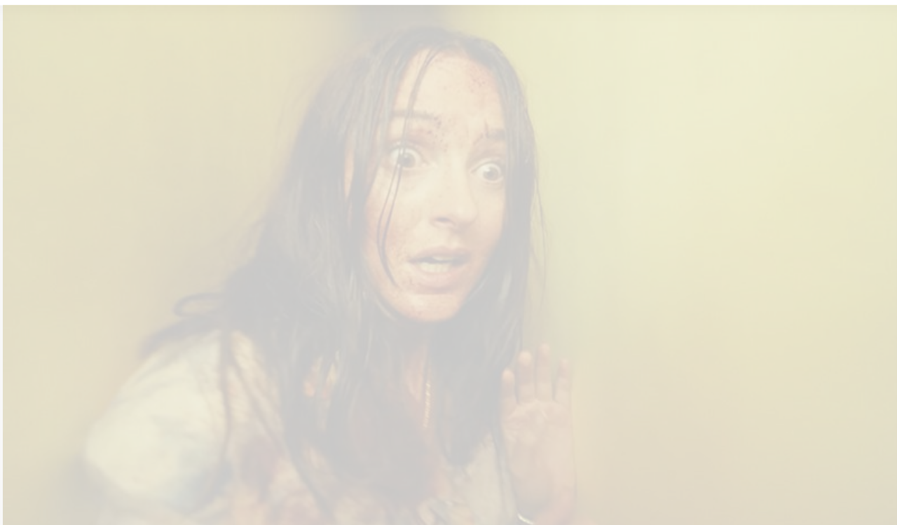
Ренате Рейнсве в фильме «Закулисье реальности»

Из других новинок в топ-10 пробилась семейная комедия «Дени и Мэни в кино!» , на 1 789 экранах выручившая 37,5 миллиона при средней посещаемости десять зрителей за сеанс и занявшая четвёртое место, и полная версия культового экшн-триллера Квентина Тарантино «Убить Билла: Кровавое дело целиком» , всего на 252 экранах за 852 сеанса собравшая 9,1 миллиона и занявшая девятое место со средней посещаемостью 16 зрителей за сеанс.