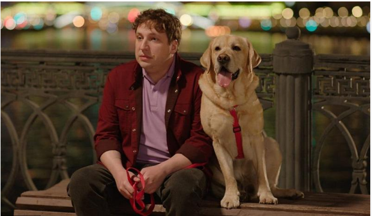
Кадр из фильма «Дени и Мэни в кино!»