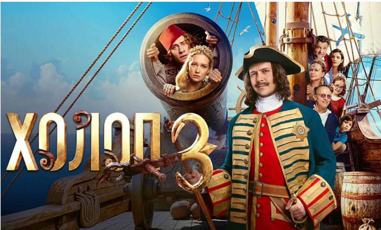
Постер к фильму «Холоп 3»

В триквеле «Холопа» зрителей встретят на экране новые главные герои в исполнении Кристины Асмус и Павла Прилучного, а также знакомые персонажи Милоша Биковича, Ивана Охлобыстина, Марии Мироновой, Александра Самойленко, Ольги Дибцевой, Натальи Рогожкиной и других актёров.