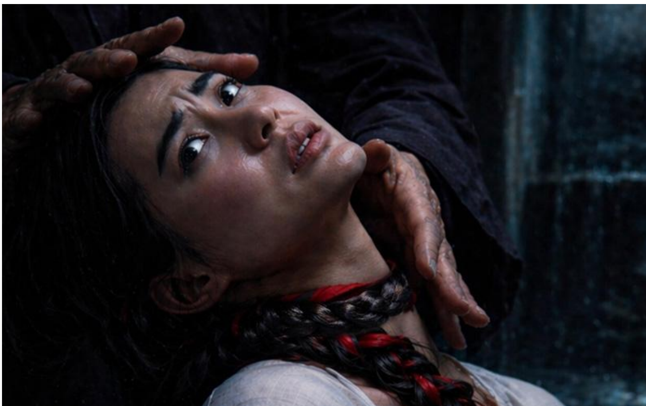
Постер к фильму «Кассандра»