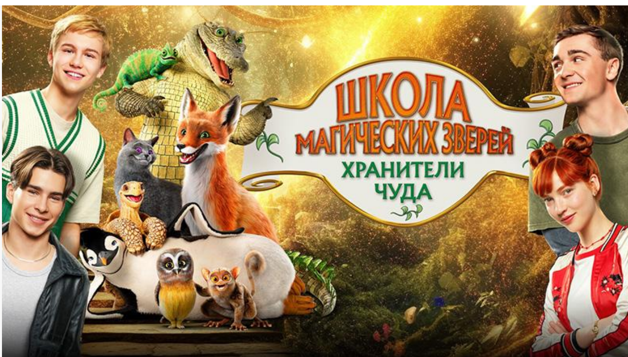
Постер к фильму «Школа магических зверей. Хранители чуда»

Фанаты аниме должны поддержать показ в кинотеатрах двух финальных серий первого сезона фэнтезийного сериала Аюму Ватанабэ « Ателье колдовских колпаков ».