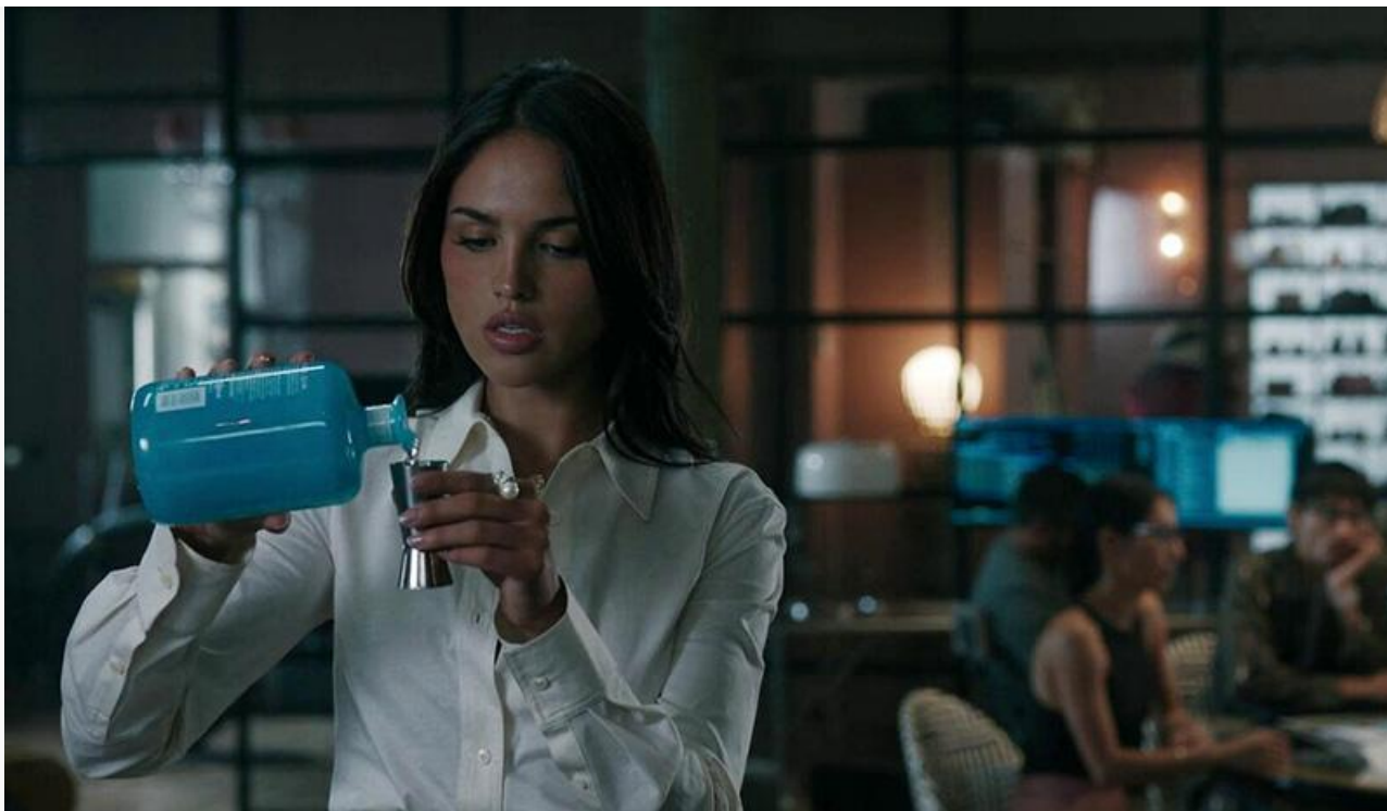
Эйса Гонсалес в фильме «Грязные деньги»

Покинули десятку лучших «Лео и Тиг. Дорога на Байкал», «Тень» и «Коммерсант».