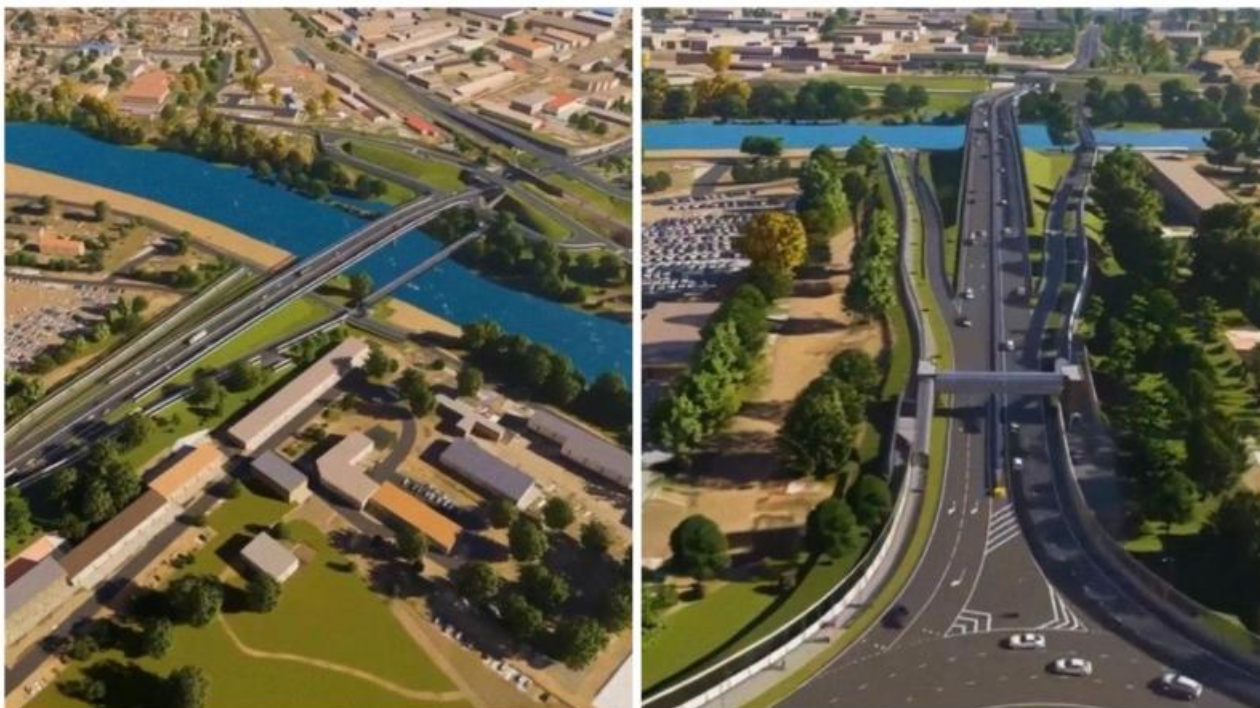
Схема транспортной развязки третьего моста и путепровода на улице Лазо