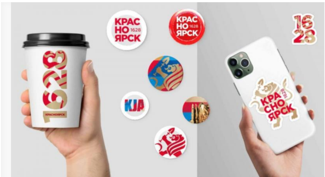
Вариант символики, представленный на форуме в 2024 году

Вопрос вызывает и дедлайн: к31 декабря 2026 года компания представит уже готовый товарный знак со стратегией продвижения и рекомендациями по использованию. Но как это возможно, если за последние десять лет администрация так и не нашла идеальный образ, а от исполнителя требуют сделать в разы больше за шесть месяцев? Стоит отметить, что в 2024-м на форуме показывали предварительный вариант фирменного стиля «Красноярск-400» с красно-сине-золотой палитрой и львом. Однако тот вариант позиционировался как первый этап, подлежащий доработке. Текущий же проект подразумевает работу с нуля.