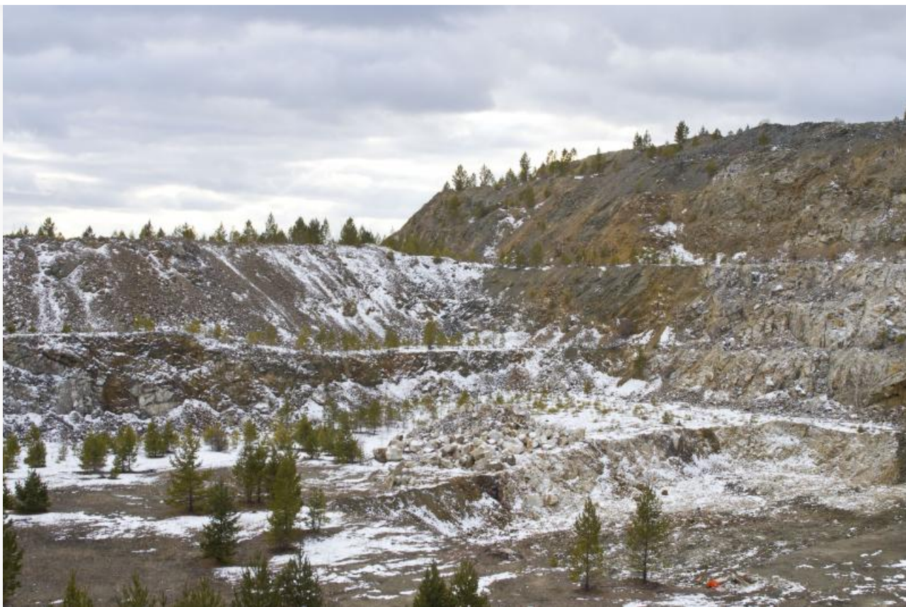
Заброшенный карьер Ермаковского месторождения

В Кижингинском районе, в 160 километрах от Улан-Удэ, инвестор готовит к запуску горно-обогатительный комбинат (ГОК) на Ермаковском флюорито-бериллиевом месторождении. Однако смета проекта выросла с первоначальных 6,4 до 14 миллиардов рублей, а обещанная независимость производства всё равно упирается в переработку сырья на территории Казахстана.