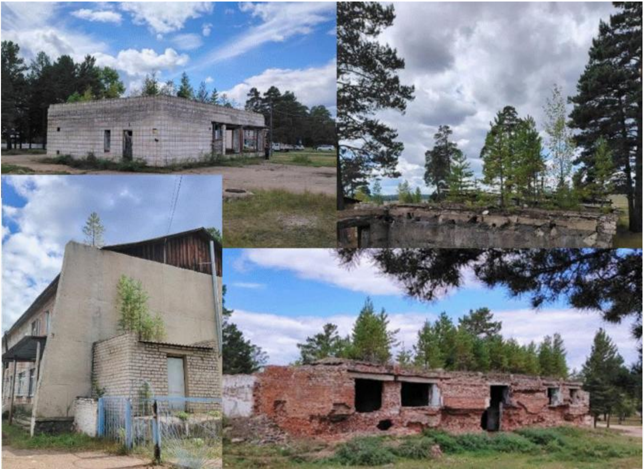
Старая инфраструктура в Новокижингинске