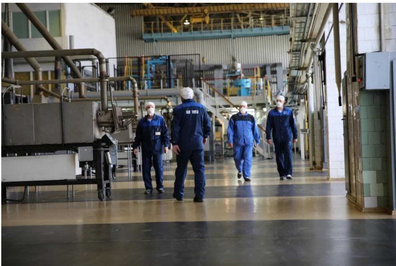
Ульяновский металлургический завод

На возведение обогатительной фабрики должны пойти 14 миллиардов рублей, однако запуск производства всё равно не решит проблему зависимости от Казахстана. Построенный в Бурятии комбинат будет производить лишь флюоритовый и бериллиевый концентраты. В России до сих пор отсутствуют промышленные мощности для глубокой гидрометаллургической переработки бериллия до чистого металла. Наладить собственный замкнутый цикл переработки в будущем планирует «Росатом», а сейчас единственным заводом на постсоветском пространстве, способным выпускать металлический бериллий, остаётся всё тот же Ульяновский металлургический завод в Казахстане.