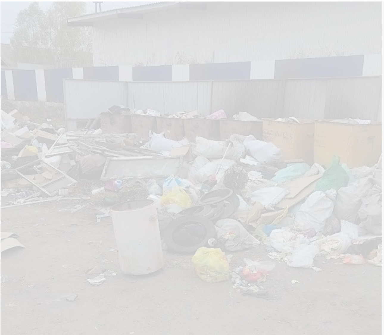
Кяхта, май 2026-го

Отдельные претензии касаются качества обслуживания. В селе Петропавловка жители пожаловались, что мусоровозы иногда проезжают мимо точек сбора отходов. И если переполненные баки с нестабильным графиком ещё можно объяснить нехваткой техники и кадров, то найти оправдание относительно последней ситуации нам трудно. Мало того что людей используют, так ещё и выставляют посмешищем.