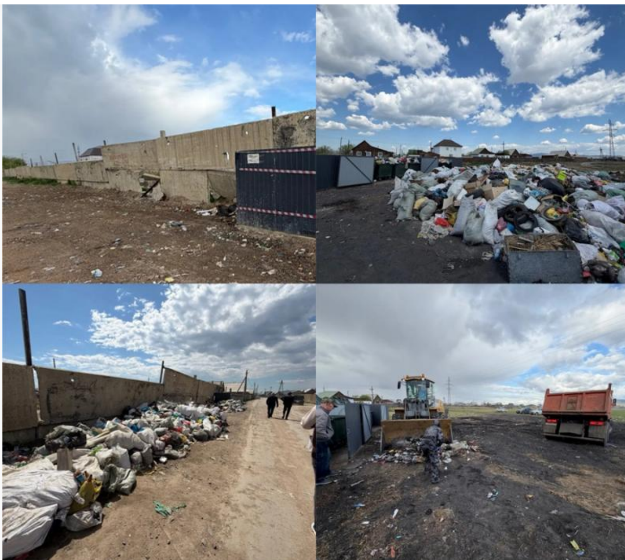
Отчёт Минприроды Бурятии

В начале июня региональный оператор в Бурятии «ЭкоАльянс» отчитался о ликвидации нескольких проблемных свалок в Иволгинском районе. Компания вместе с районной администрацией вывезла отходы с контейнерных площадок на улицах Сочинской, Прокурорской, Новогодней и других участках. Одновременно предприятие в очередной раз напомнило жителям, что контейнеры предназначены только для твёрдых коммунальных отходов. Строительный мусор, автомобильные шины, грунт, ветки и золу необходимо утилизировать отдельно.