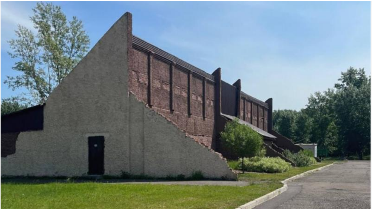
Трибуна до начала строительства