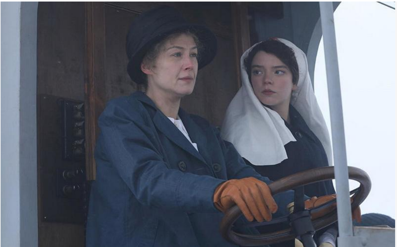
Кадр из фильма «Опасный элемент», 2019 год