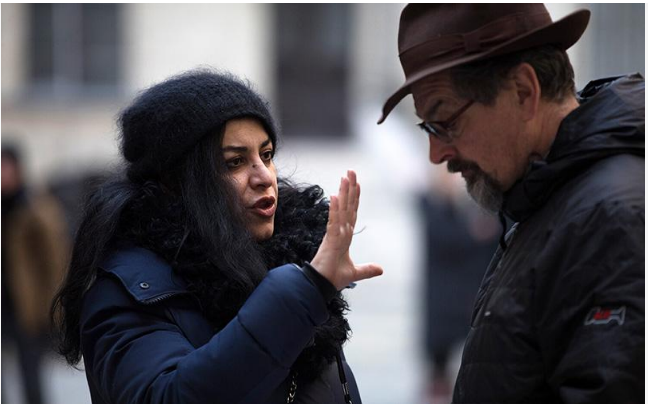
Маржан Сатрапи на съёмках фильма «Опасный элемент»