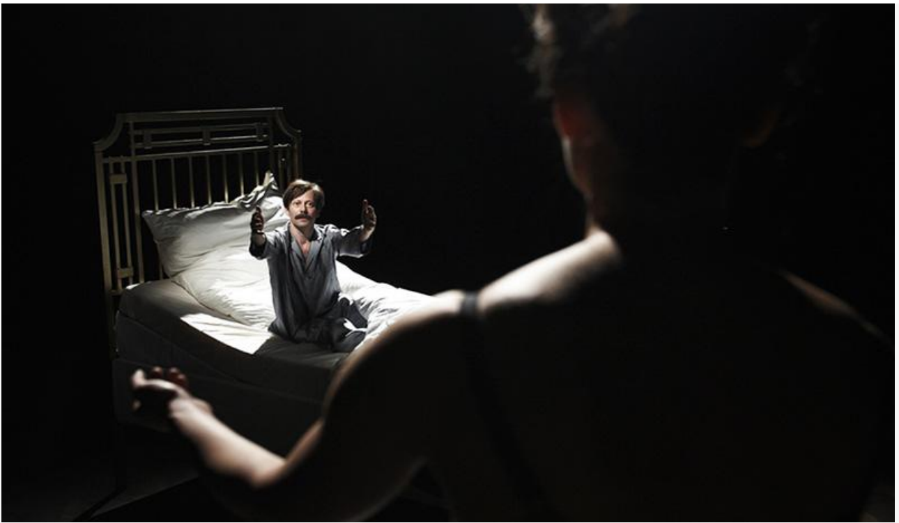
Кадр из фильма «Цыплёнок с черносливом», 2011 год