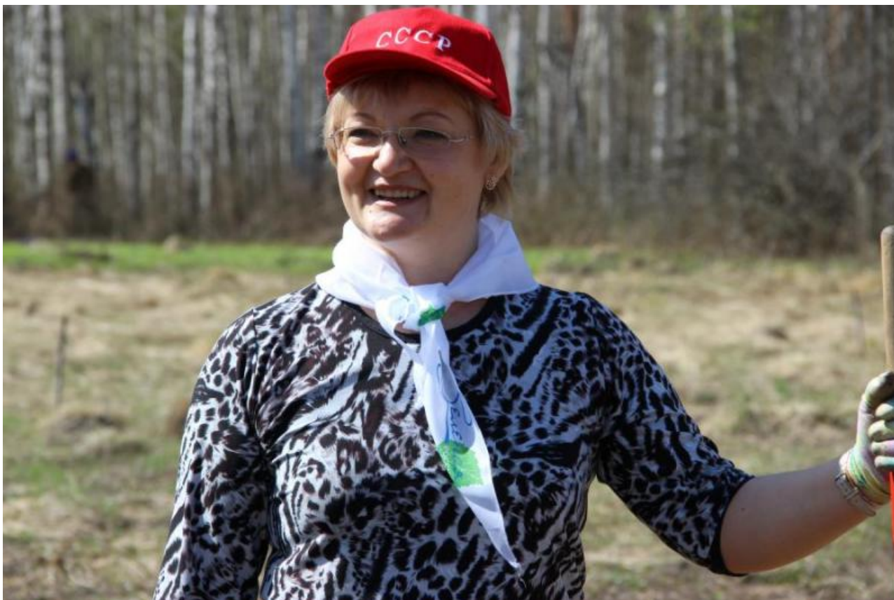
Фото: duma.tomsk.ru , kprf.ru

Автор: Андрей Тихонов © Babr24.com ПОЛИТИКА, НЕДВИЖИМОСТЬ, ТОМСК 17 04.06.2026, 21:26