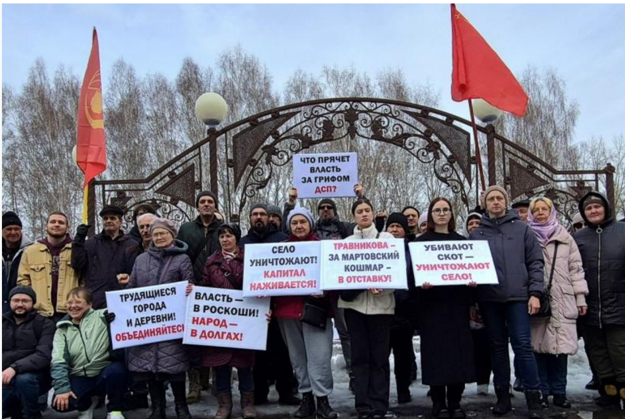
29 марта 2026 года в Новосибирске состоялся митинг против массового уничтожения скота

Власти Новосибирской области своими действиями спровоцировали локальное бедствие. Уничтожив поголовье скота у фермеров, чиновники оставили после себя загрязнённую воду и кучи гниющего навоза с остатками подстилки. Попытки профильного министерства переложить ответственность на администрации сельсоветов выглядят как нежелание отвечать за последствия на областном уровне. Грязные стоки уже фиксируются в притоках, ставя под угрозу безопасность крупного водохранилища.