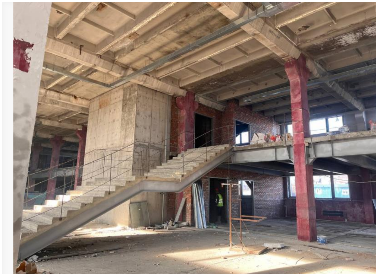
Строительная площадка Центра креативных индустрий в Улан-Удэ