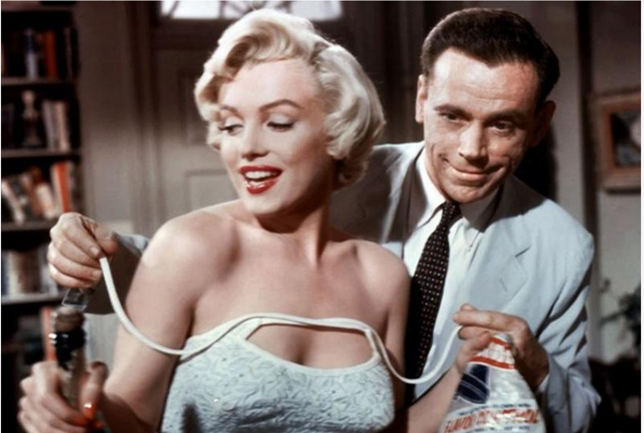
Девушка в фильме «Зуд седьмого года», 1955 год. Номинация на премию Британской киноакадемии BAFTA в