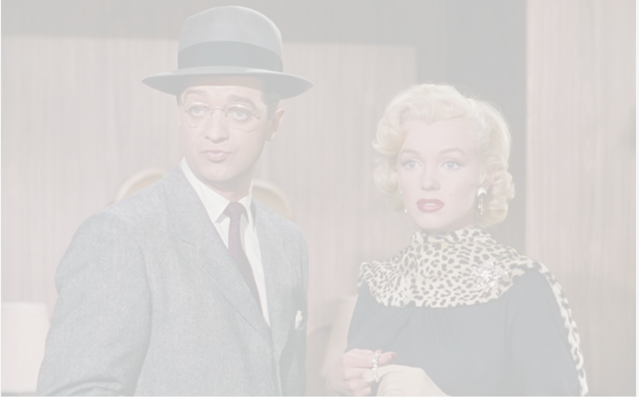
Лорелей Ли в фильме «Джентльмены предпочитают блондинок», 1953 год

Если мне чуточку повезёт, когда-нибудь я узнаю, почему людей так мучают проблемы секса. Меня лично они волнуют не больше, чем чистка ботинок.