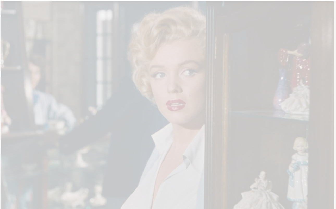
Роуз Лумис в фильме «Ниагара», 1952 год

Карьера – чудесная вещь, но она никого не согреет в холодную ночь.