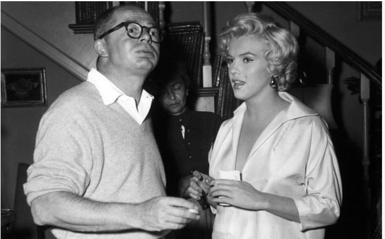
С Билли Уайлдером на съёмках фильма «В джазе только девушки»