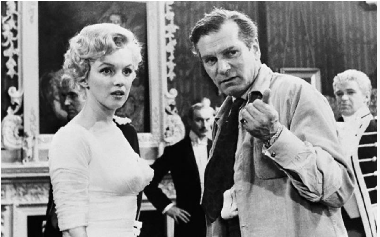
С Лоуренсом Оливье на съёмках фильма «Принц и танцовщица»