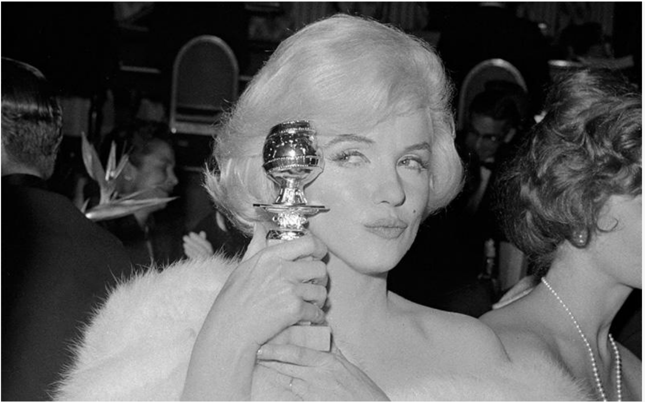
С премией «Золотой глобус» за фильм «В джазе только девушки», 1960 год

В 1960 году на голливудской «Аллее славы» была открыта именная звезда Мэрилин Монро. А за пять месяцев до смерти на церемонии вручения «Золотого глобуса» Монро удостоилась Премии Генриетты как самая популярная актриса.