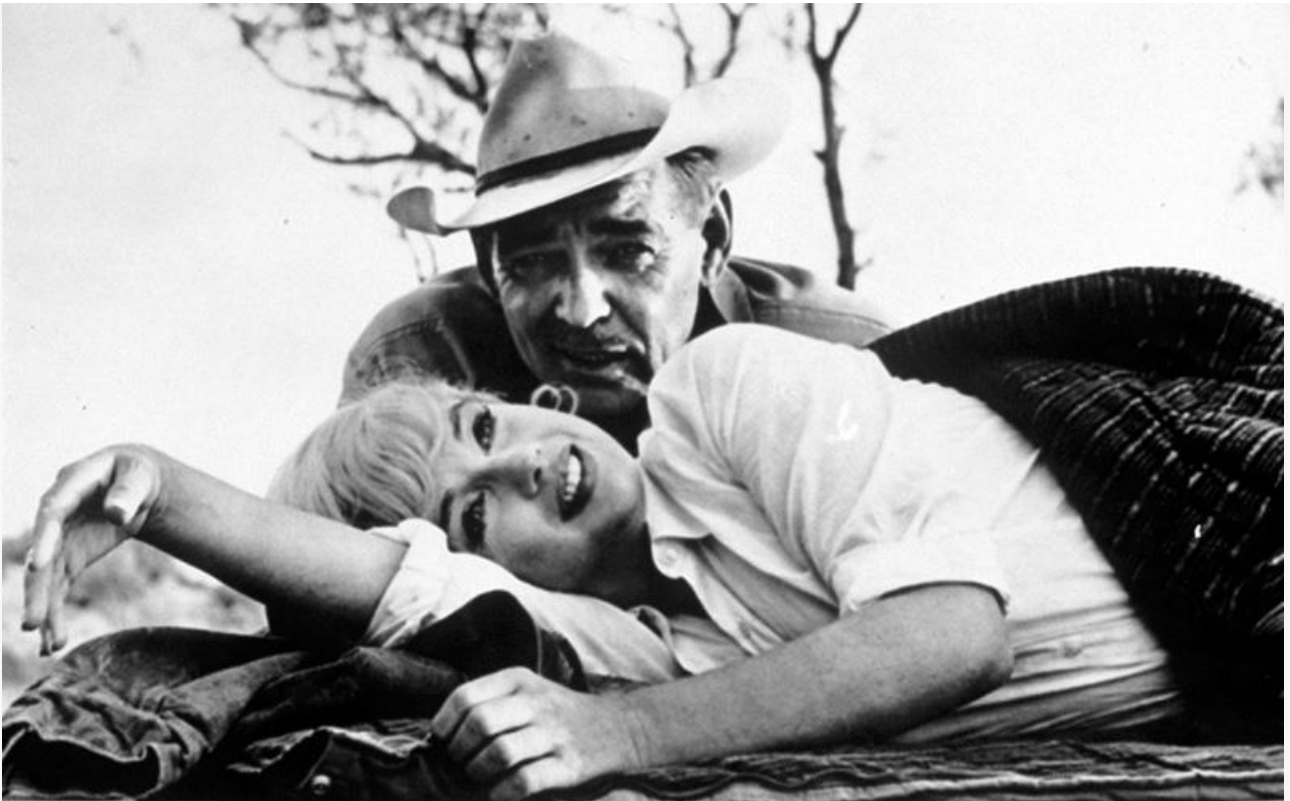
Розлин Тэйбер в фильме «Неприкаянные», 1961 год