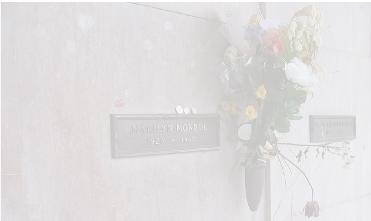
Склеп № 24 в Вествуд-Виллидж

К 100-летию легендарной женщины и актрисы мы вспоминаем кадры из фильмов с её участием и её не по годам мудрые цитаты из интервью, а также фразы из книги «Поцелуй без любви», составленной на основе записей личного психоаналитика Мэрилин Монро.