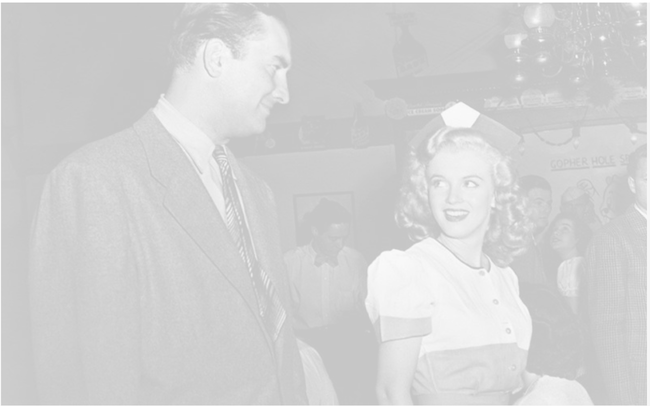
Официантка Эви в фильме «Опасные годы». Первая роль в кино, 1947 год