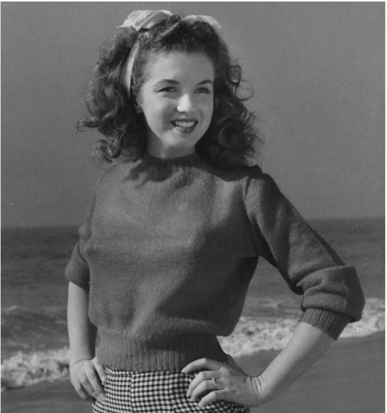
Мэрилин Монро в юности

В кино юная красавица дебютировала в 1947 году и за 15 лет ярчайшей карьеры снялась в 30 фильмах. Наиболее значимые из них – «Асфальтовые джунгли» и «Неприкаянные» Джона Хьюстона, «Давай сделаем это легально» Ричарда Сейла, «Стычка в ночи» Фрица Ланга, «Можешь не стучать» Роя Уорда Бейкера, «Ниагара» Генри Хэттуэя, «Джентльмены предпочитают блондинок» Ховарда Хоукса, «Как выйти замуж за миллионера» Жана Негулеско, «Автобусная остановка» Джошуа Логана, «Принц и танцовщица» Лоуренса Оливье, «В джазе только девушки» Билли Уайлдера, «Займёмся любовью» Джорджа Кьюкора.