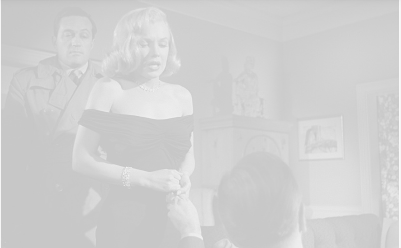
Анджела Финлей в фильме «Асфальтовые джунгли», 1950 год

Умная девушка целует, но не любит. Слушает, но не верит. И уходит до того, как её оставили.