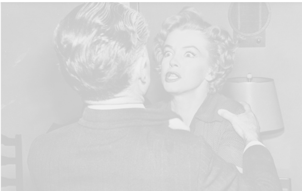
Нелл Форбс в фильме «Можешь не стучать»,