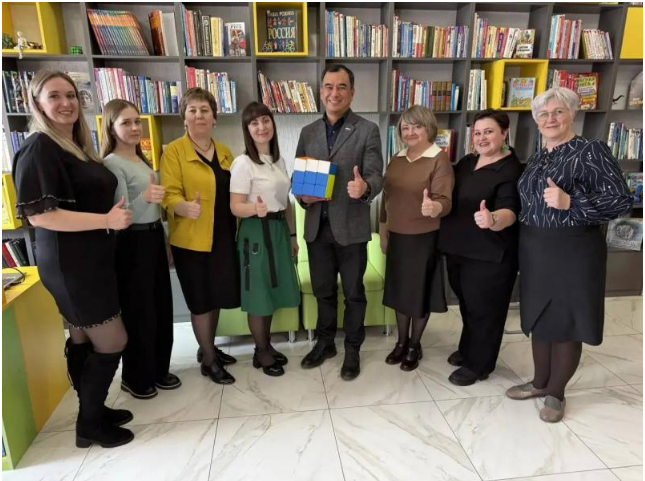
Пока не зарегистрированный кандидат, спешит засветиться с разнообразным электоратом, в том числе с детьми, что при официальной регистрации будет невозможно.