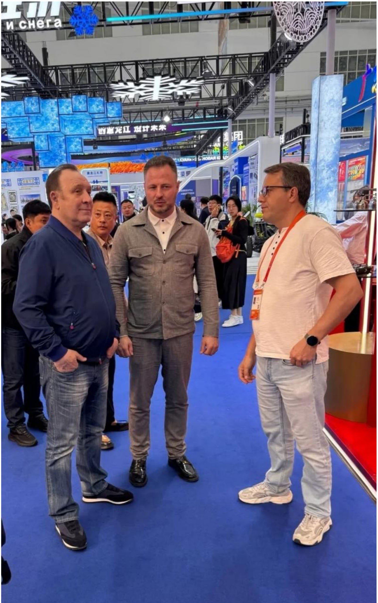
Чтобы напомнить еще раз, что в действующем созыве думы Иркутского округа встал колом уже несколько