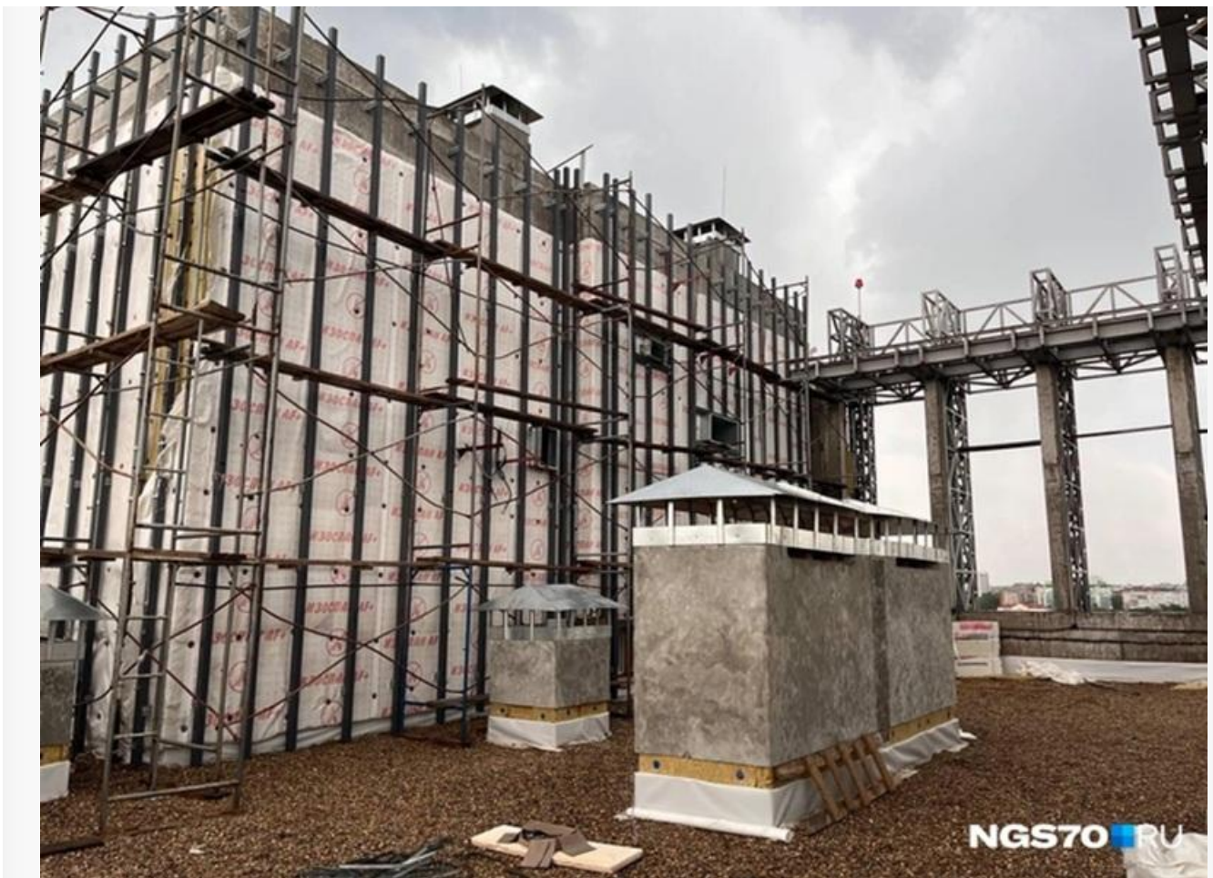
Так выглядела крыша сданного дома

Правоохранительные органы выявили серьёзные нарушения в работе руководства обанкротившейся фирмы. Бывшего директора подозревают в злоупотреблении полномочиями при строительстве. Проверка местной прокуратуры показала, что один из домов возводился за счёт банковского кредитования, однако руководитель прямо нарушил условия договора.