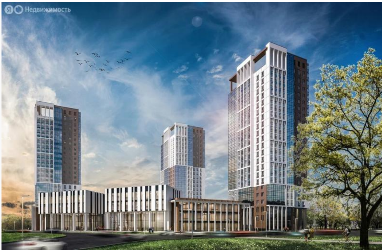
Визуализация проекта ЖК «Стрижи»

Презентация амбициозного жилого комплекса на пересечении улицы Учебной и Московского тракта прошла ещё в 2018 году. Застройщик планировал возвести три башни по 24 этажа общей стоимостью пять миллиардов рублей. Сдать первый дом обещали в третьем квартале 2023 года, но в итоге сроки оказались полностью сорваны. К марту 2025 года в эксплуатацию ввели лишь одно здание из трёх.