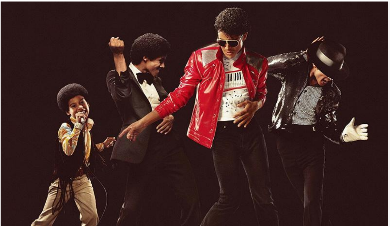
Постер к фильму «Майкл»