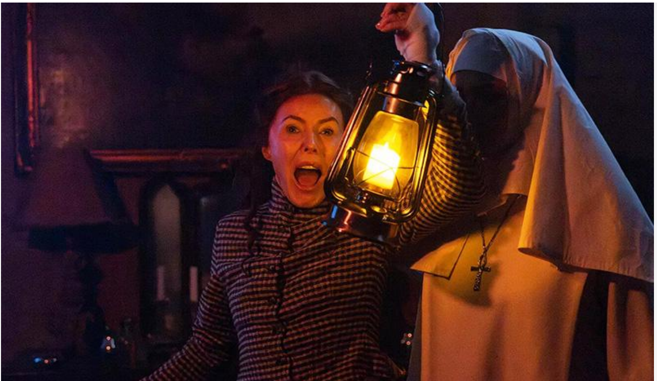
Кадр из фильма «Монахиня из Борли. Возвращение»

Также выходят на экраны французская спортивная драмеда Антони Марсьяно « Мечтать не вредно » с Жан-Паскалем Зади и Рафаэлем Кенаром, американская семейная комедия « Котятта учатся летать » и два аниме: « Зомбилэнд-сага. Фильм » и « ЧаО » Ясухиро Аоки.