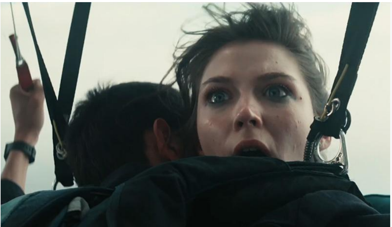
Кадр из фильма «Пропась»