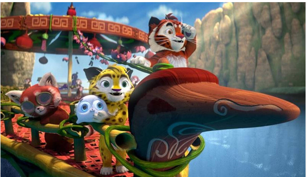
Кадр из фильма «Лео и

Также сохранили места в десятке лидеров проката «Ангелы Ладогои» (6,6 миллиона с потерей в сборах 72 % и восьмое место), «Вверх по волшебному дереву» (5,5 миллиона с потерей в сборах 73 % и девятое место) и «Своя в доску» (4,4 миллиона с потерей в сборах 70 % и десятое место).