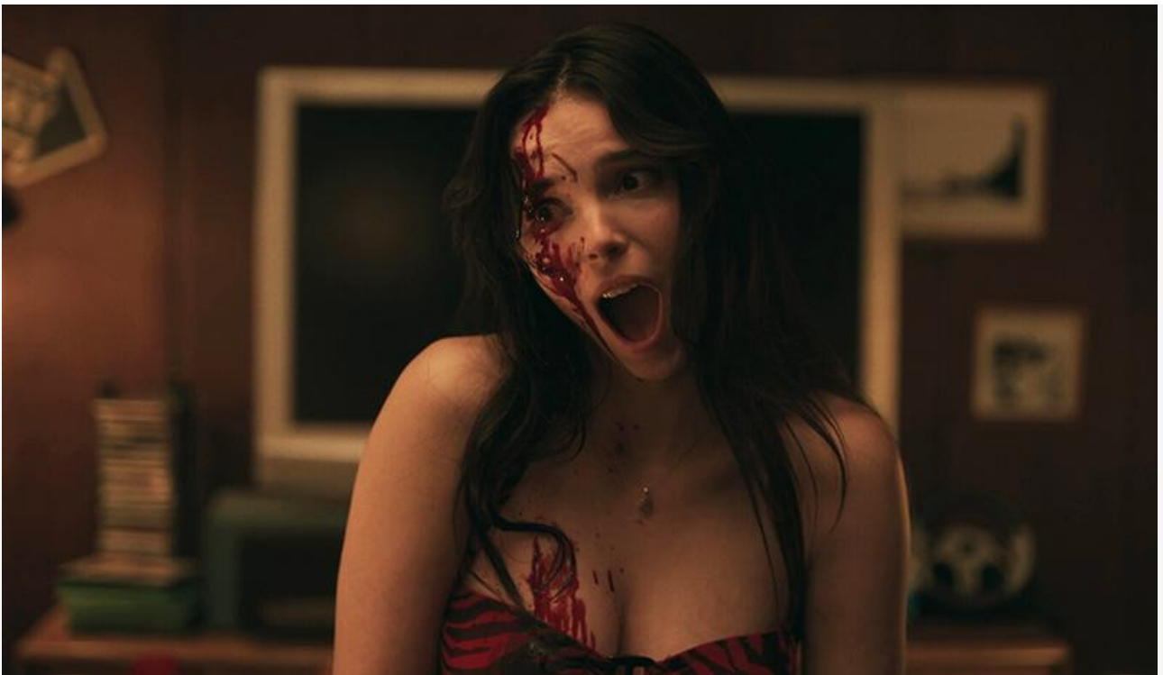
Инде Наварретт в фильме «Обсессия»

Отечественные семейные новинки встретили утро понедельника на второй и четвёртой строках чарта. Новый эпизод популярной франшизы «Не одна дома 3. Выпускной» Митрия Семёнова-Алейникова на 2 1151 экране за 14,9 тысячи сеансов заработал 61 миллион при средней посещаемости десять зрителей за сеанс. Фэнтезийная комедия Павла Воронина «Богатыри» с Романом Курцыным, Романом Поставаловым, Алёной Михайловой и Кариной Разумовской на 2 264 экранах за 10 тысяч сеансов собрала 32,5 миллиона при средней посещаемости девять зрителей за сеанс.