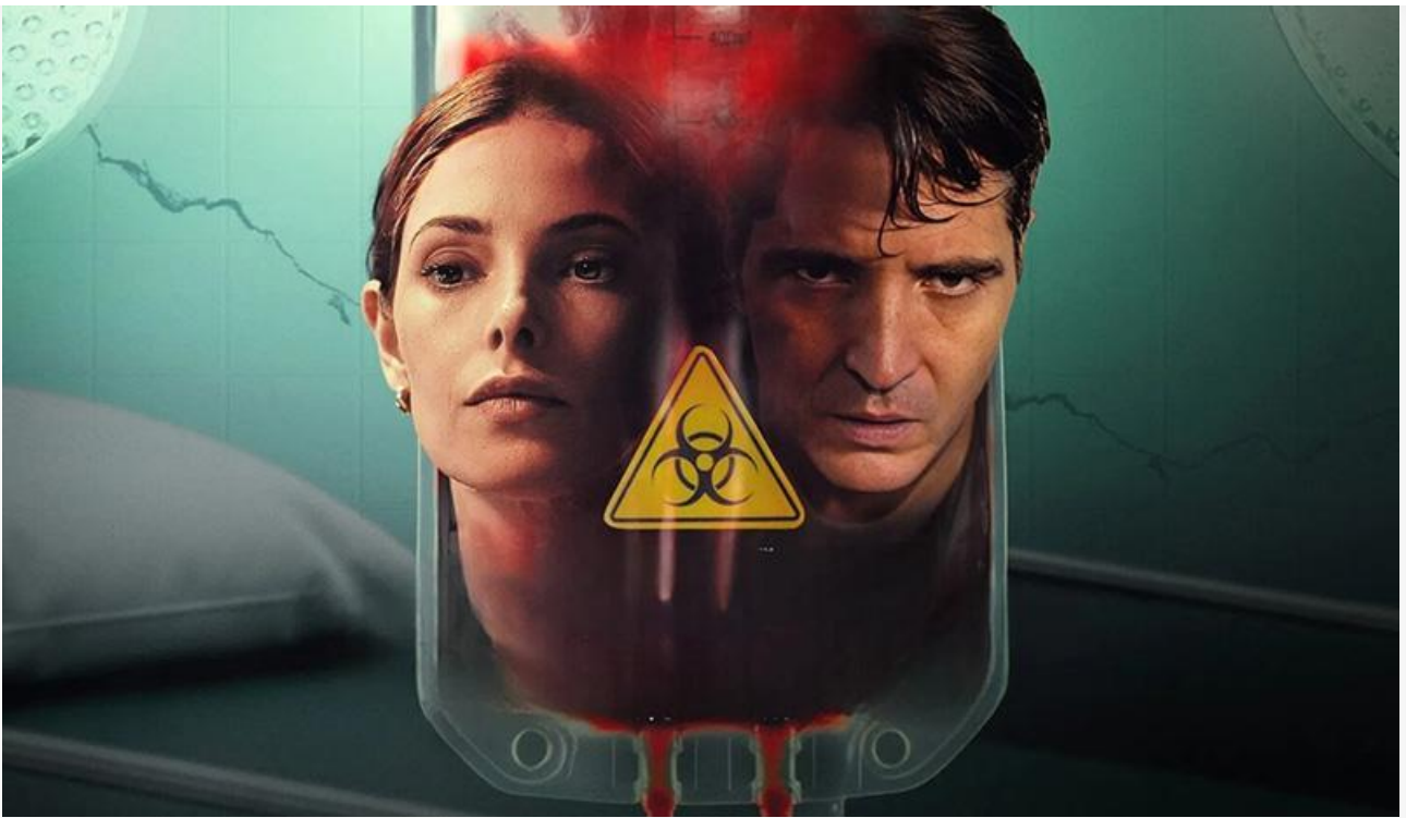
Постер к фильму «Обитель зла: Мутация»