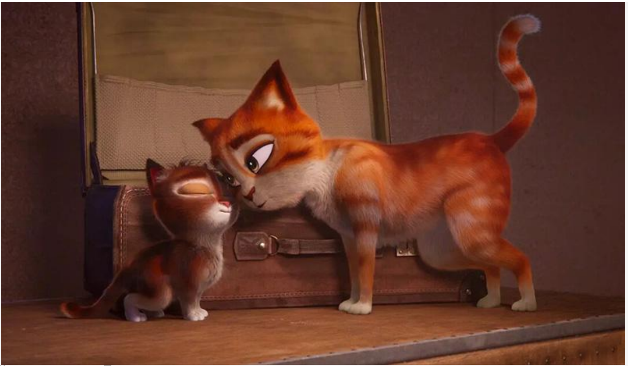
Кадр из фильма «Тень»

Лучшая новинка предыдущих выходных – мультфильм Антона Ланшакова «Лео и Тиг. Дорога на Байкал» – потерял в сборах 42 % и, пополнив копилку на 28,5 миллиона, опустился со второго на пятое место.