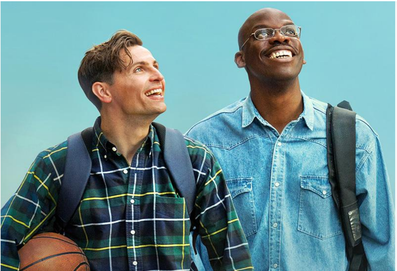
Постер к фильму «Мечтать не вредно»