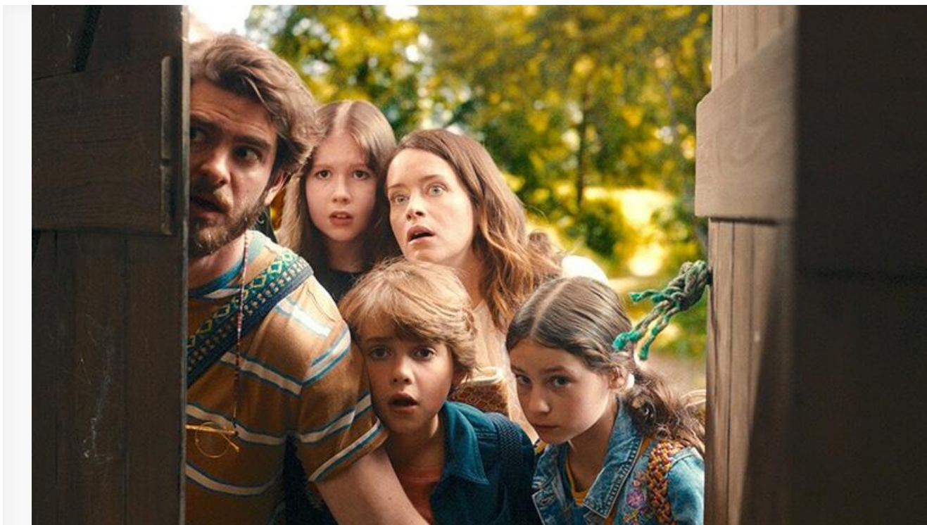
Кадр из фильма «Вверх по волшебному дереву»

Покинули десятку лучших «Хокум», «Вот это драма!», «Семь вёрст до рассвета», «Опасные отношения» и «Ждун 2».