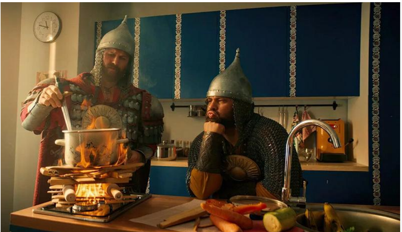
Кадр из фильма «Богатыри»

Пробился в топовую десятку и германский мультфильм Мохаммада Пирзади «Тень» : 8,3 миллиона за 2,8 тысячи сеансов, восемь зрителей за сеанс и седьмое место.