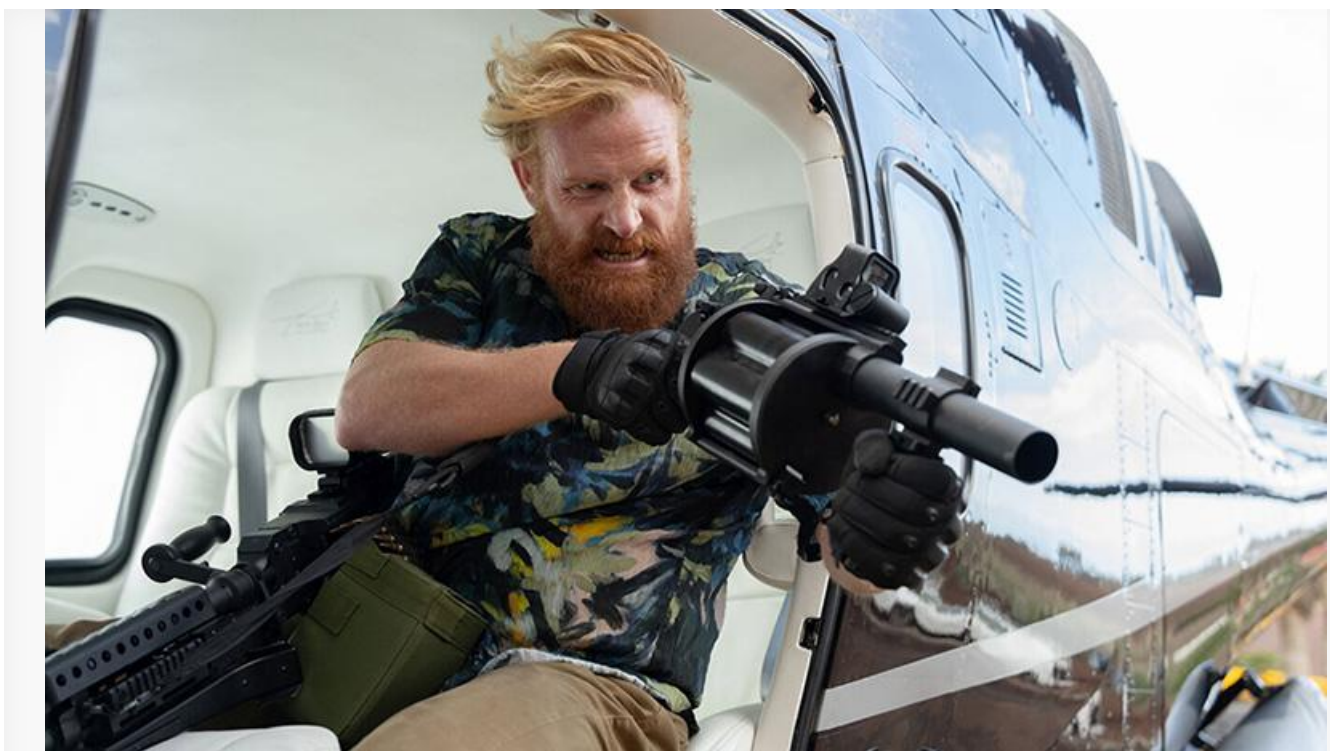
Кристофер Хивью в фильме «Грязные деньги»

До «Грязных денег» на вершину российского чарта в этом году из иностранцев забирались лишь «Горничная», «Наследник» и «Вот это драма!». Средняя посещаемость громкой новинки – 11 зрителей за сеанс.