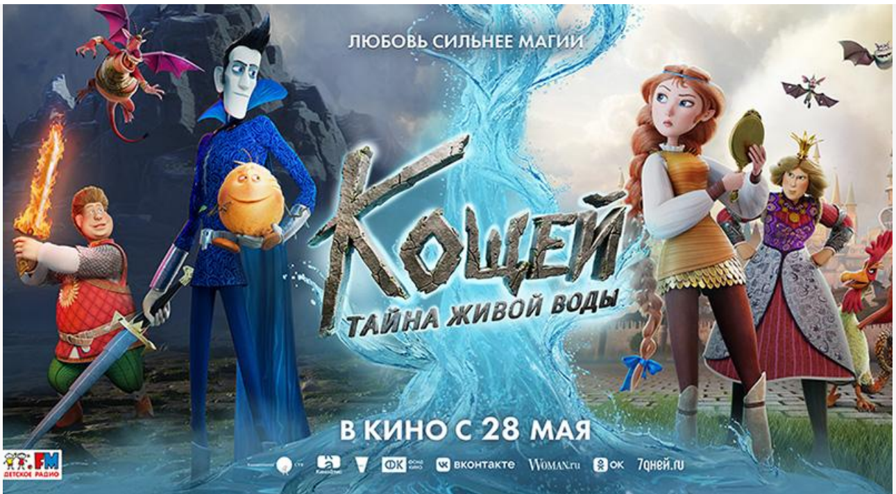
Постер к фильму «Кощей. Тайна живой воды»

Любителей фильмов ужасов ждут в кинотеатрах британская « Монахиня из Борли. Возвращение » (18+) Стивена М. Смита и американский триллер Нэнси Леопарди « Обитель зла: Мутация » (18+).