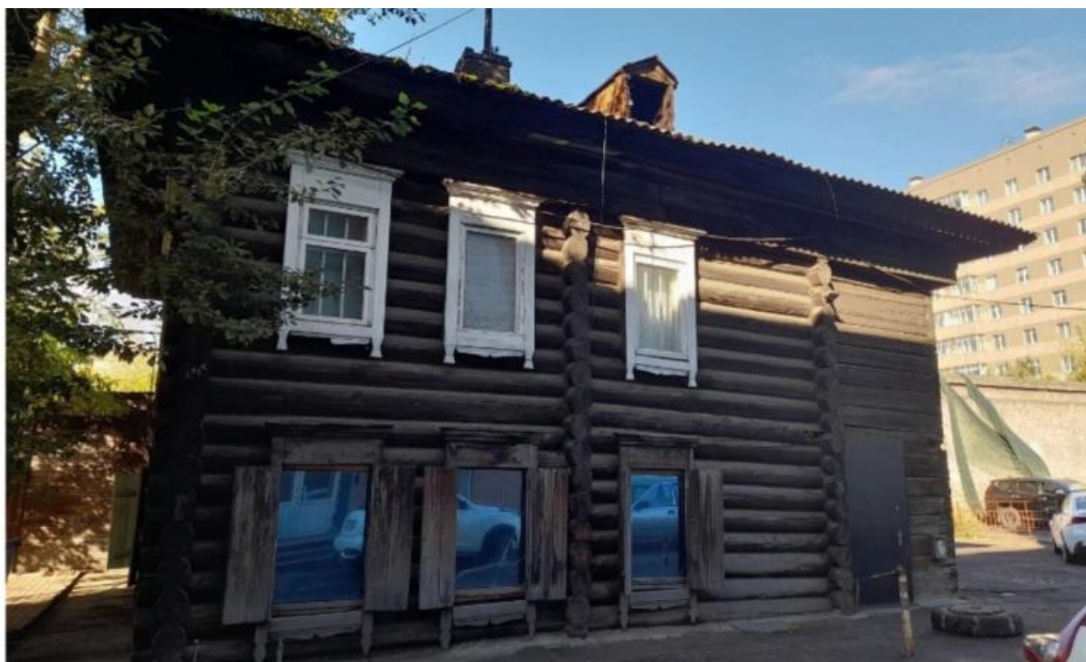
Здание по адресу Ленина, 74Г

В результате внимание СМИ и жителей помогло оперативно исправить бюрократическую ошибку и благополучно разрешить ситуацию о демонтаже. Город сохранит не просто место, а важный элемент истории о людях, чьи достижения вознесли Красноярск на новые вершины.