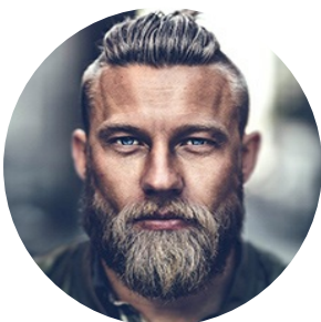
Автор текста: Георгий