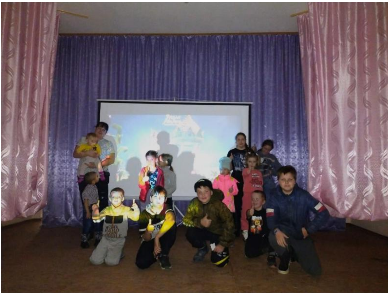
Фото: tomsk.ldpr.ru , duma.tomsk.ru , duma70.ru

Автор: Андрей Тихонов © Babr24.com ПОЛИТИКА, НЕДВИЖИМОСТЬ, ТОМСК 👁 51 26.05.2026, 15:01