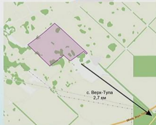
Расположение КПО «Левобережный»