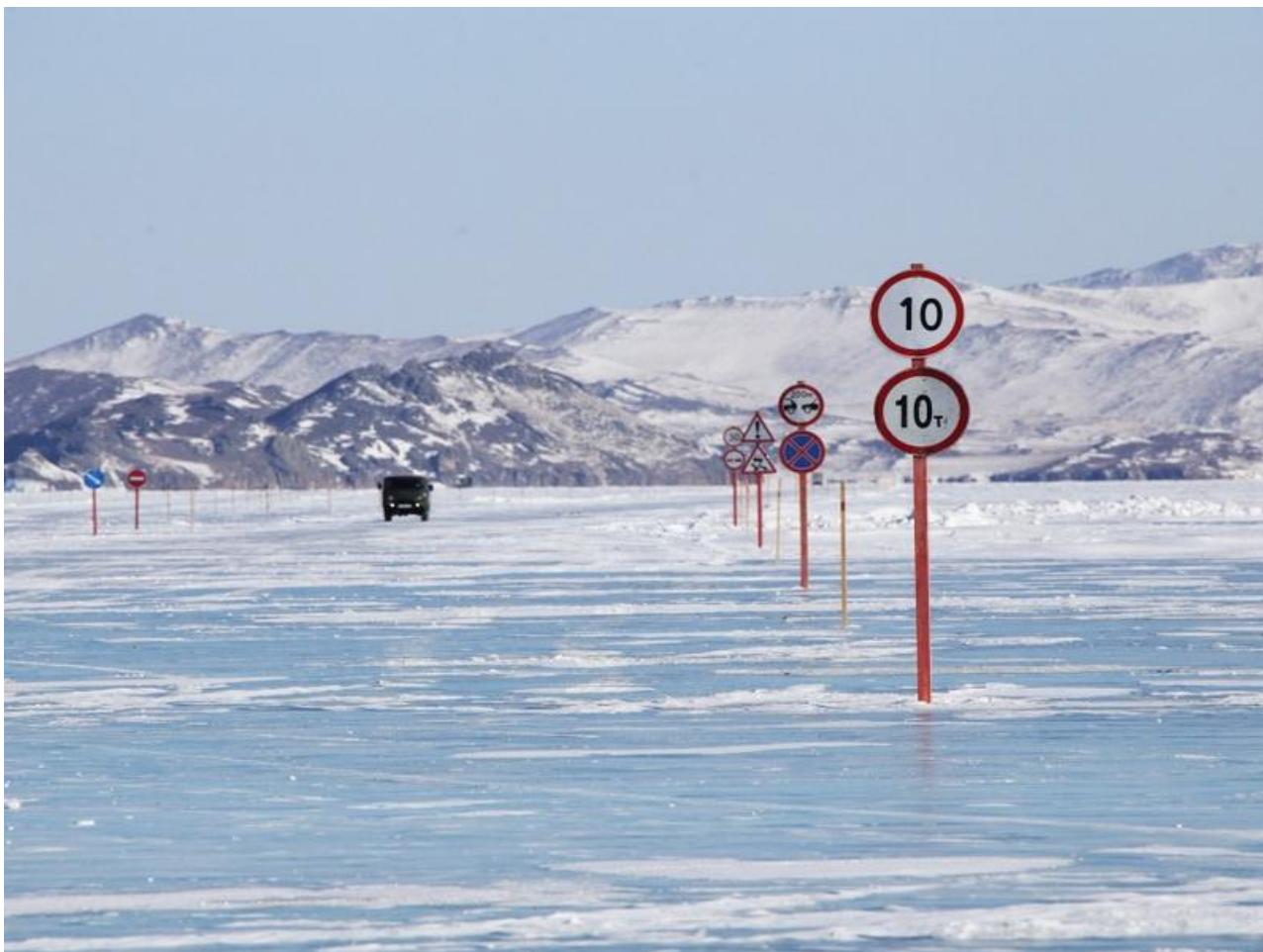
Фото: архив ГУ МЧС России по Иркутской области

Автор: Алина Саратова © Babr24.com ТРАНСПОРТ, ИРКУТСК 👁 7 20.05.2026, 15:52