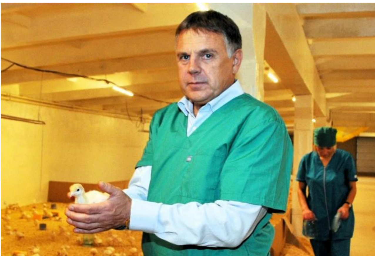
Птенцы гнезда Петрова все-таки уязвимы