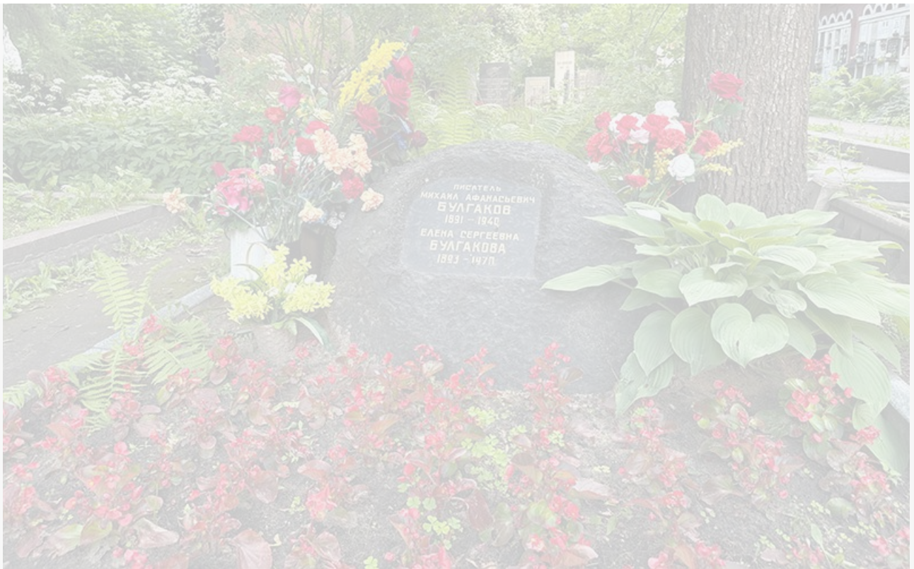
Могила Михаила Булгакова

Юбилеи писателей мы традиционно отмечаем публикацией цитат из их произведений. Сегодня это мысли Михаила Булгакова и фразы его героев из повести «Собачье сердце» и неоконченного романа «Театральный роман», впервые опубликованных в СССР спустя десятилетия после смерти автора.