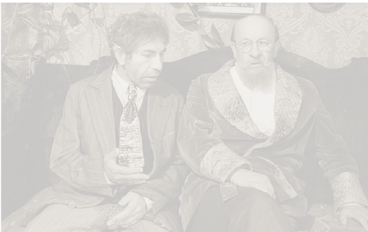
Владимир Толоконников и Евгений Евстигнеев в фильме Владимира Бортко «Собачье сердце», 1988 год